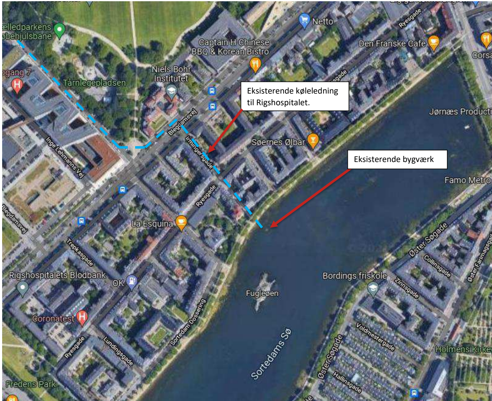
Placering af eksisterende bygværk og køleledning