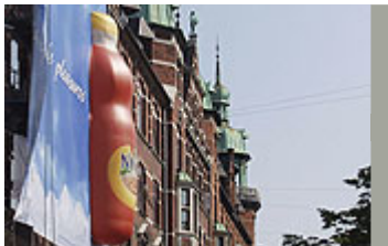
Stilladsreklamer kan være et voldsomt element i gadebilledet.