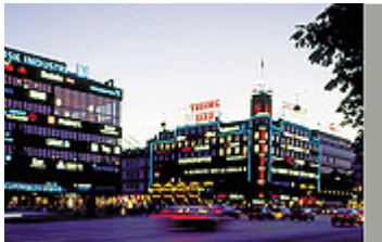
Lysreklamer på Rådhuspladsen

Reklamer i det offentlige rum spiller en stigende rolle i den moderne by. Byens udvikling og erhvervslivets interesse for synliggørelse gennem udendørsreklamering skaber et øget pres for flere reklamer i byen. Samtidig er København en meget velbevaret by, med en lang række særlige bymæssige og arkitektoniske kvaliteter, der bør respekteres ved fastlæggelse af retningslinier for udendørs reklamer.