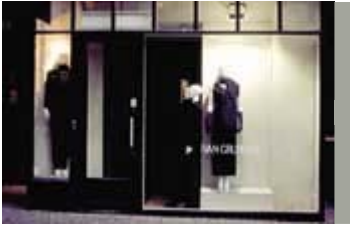
Lyset fra butiksudstillingen er ofte tilstrækkelig belysning, Niels Hemmingsens Gade 4.