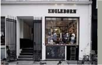
Enkel skiltning med malede bogstaver, Amagertorv 1.