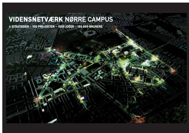
Nørre Campus udbygges de næste år for et tocifret milliardbeløb.

Den nye vej forventes at reducere trafikken på Lyngbyvej med ca. 15.000 biler i døgnnet, hvilket giver plads til en højklasset busforbindelse.