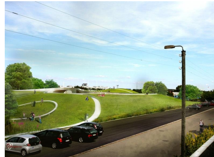
Sydhavn Genbrugscenter er forsøgt indpasset i omgivelserne og særligt er der i udformningen taget hensyn til det nærliggende naturområde "Tippen".

Genstanden kan også være fx flamingo, som kan indgå i et forsøg med at genbruge flamingo til isolering. Eller måske er genstanden en trapezplade, som en genbrugsbyggevirksomhed gerne vil aftage. Eller det er nogle gamle ødelagte persiener, som skal ind i jern- og metalcontaineren på genbrugsstationen.