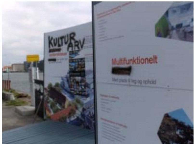
Udstillingen på grunden har flere gange været udsat for hærværk

Der er derudover igangsat et samarbejde om aktivering af grunden med kunstnergruppen Parfyme under kunstkvadrienen U-turn. Dette samarbejde skal pågå på grunden, hen over sommeren.