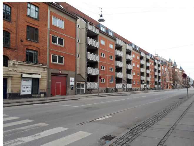
Holmbladsgade set fra Vermlandsgade

Området ligger i den kystnære del af byzonen. På grund af den betydelige afstand samt de mellemliggende bebyggelser og anlæg opfattes området imidlertid ikke som en del af kysten. En visualisering i forhold hertil er derfor ikke påkrævet.