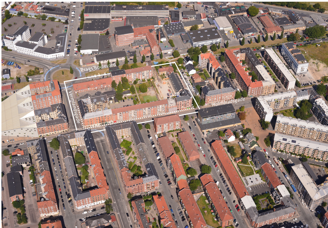
Luftfoto af området set fra vest. Lokalplan nr. 138 er angivet med hvid linje. Området for tillæg nr. 1 er angivet med hvid, stiplede linje.