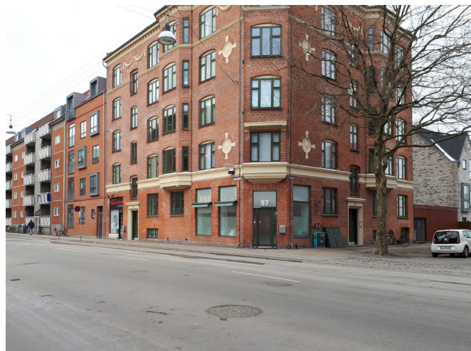
Holmbladsgade set fra Carlsgade

Fællesskab København vil spille sammen med og styrke en række andre af kommunens politikker, planer og strategier.