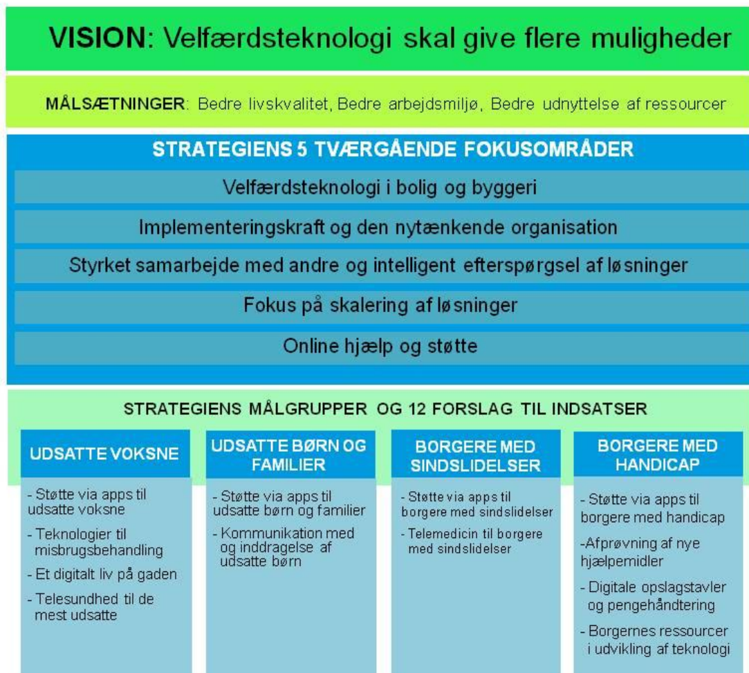
Handleplanens vision, mål, fokusområder og forslag til indsatser

Vi præsenterer en række forslag til konkrete indsatser, der kan indgå i forvaltningens fremadrettede arbejde. Det gør vi for at vise hvor vi står lige nu, og som en invitation til videre samarbejde omkring fremtidens indsatser – både til eksterne partnere og til de brugere og medarbejdere, der skal arbejde med de nye løsninger i hverdagen. Nogle af indsatserne kan vi sætte i gang med det samme, men skal alle handleplanens indsatser realiseres, vil det kræve yderligere finansiering i fremtiden. Det vil vi prøve at sikre gennem samarbejde med andre, midler fra relevante fonde og forslag til kommunale investeringer i de kommende år. Figuren nedenfor giver et samlet overblik over handleplanen.