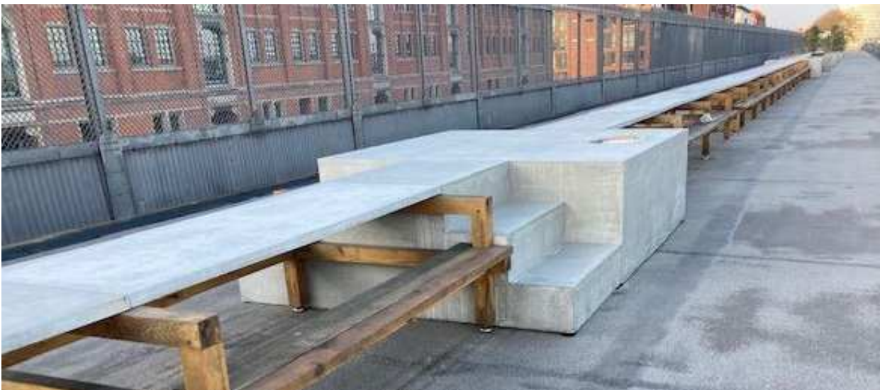
Podie med trappe, der giver mulighed for at krydse anlægget. Opstillet af ejer