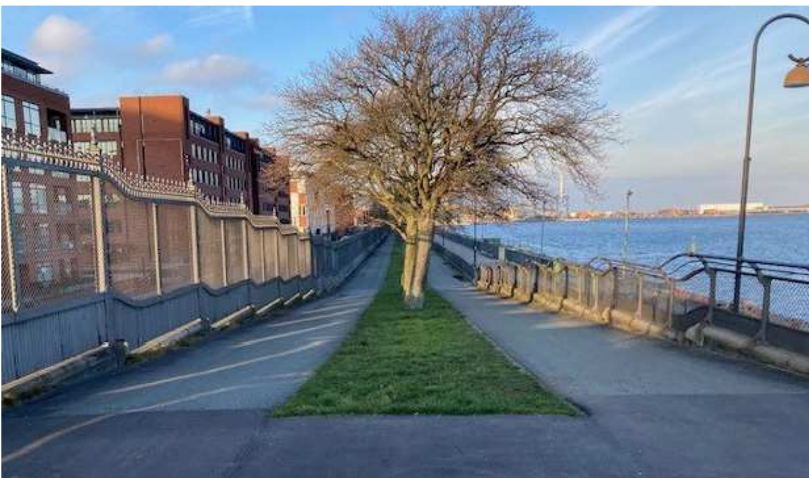
Midterrabbatten med træer, der ligger i fortsættelse af anlægget i nordlig retning. Ikke ændret