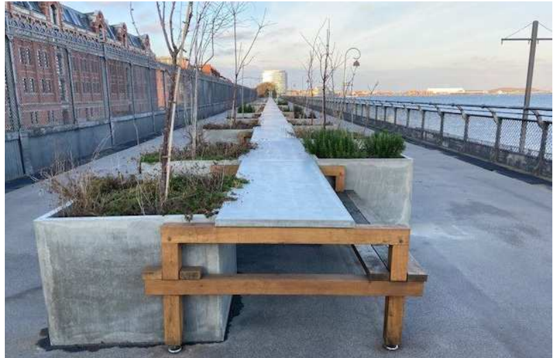
Passager på tværs giver mulighed for at krydse anlægget. Opstillet af ejer