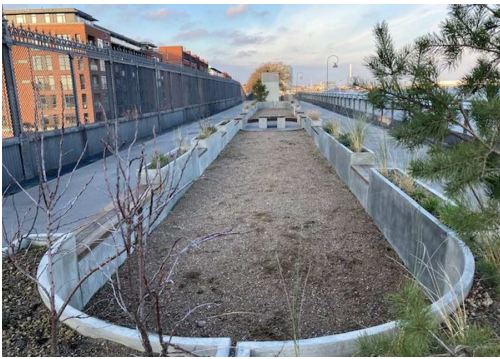
Petanque. Opstillet af ejer