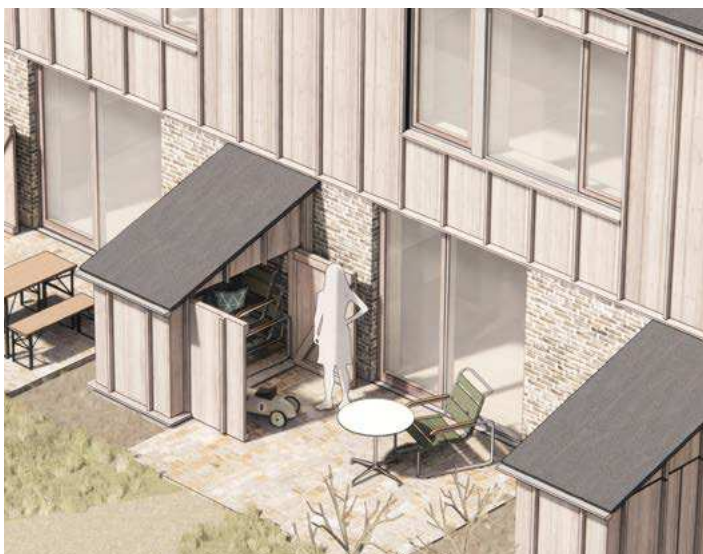
Illustration af mulig udformning af skur på haveseide