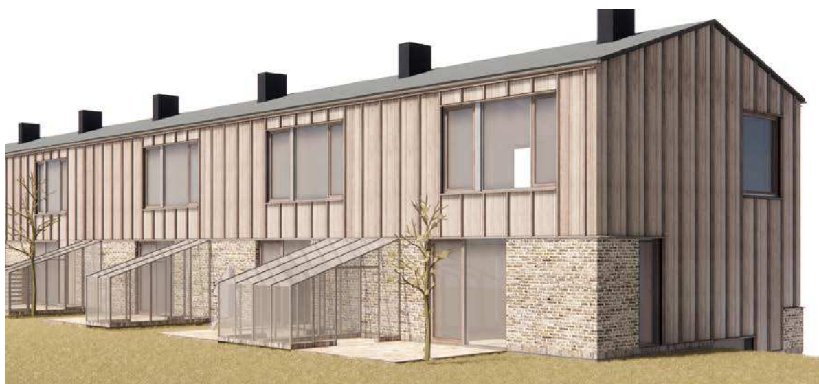
Illustrationer af fra udviklingen af Lokalplan 609 der viser principper for den lokalplanlagte udformning af drivhuse