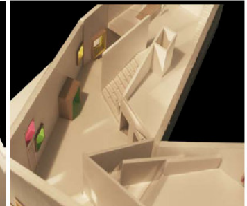
TORVET ER DET SAMMENBINDENDE RUM MED UDSYN TIL ALLE PRIMÆRE FACILITETER.