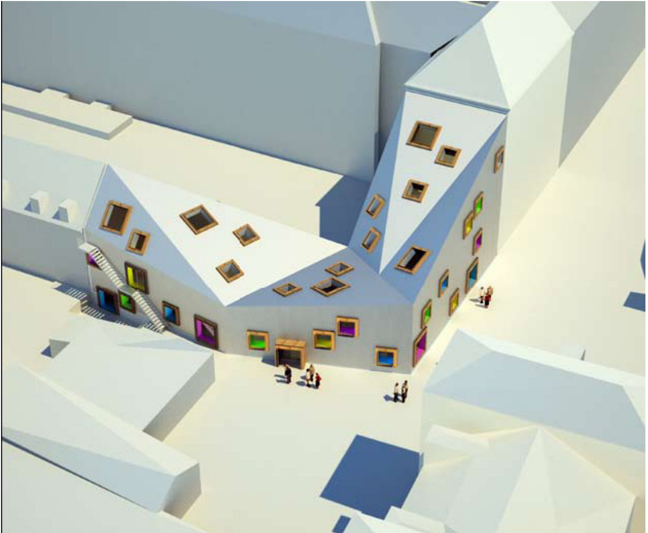
Bygningen i kontekst