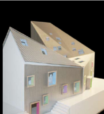
HUSET SKALERES NED MOD TORVET, BÅDE DET UDVENDIG OG DET INDVENDIGE.