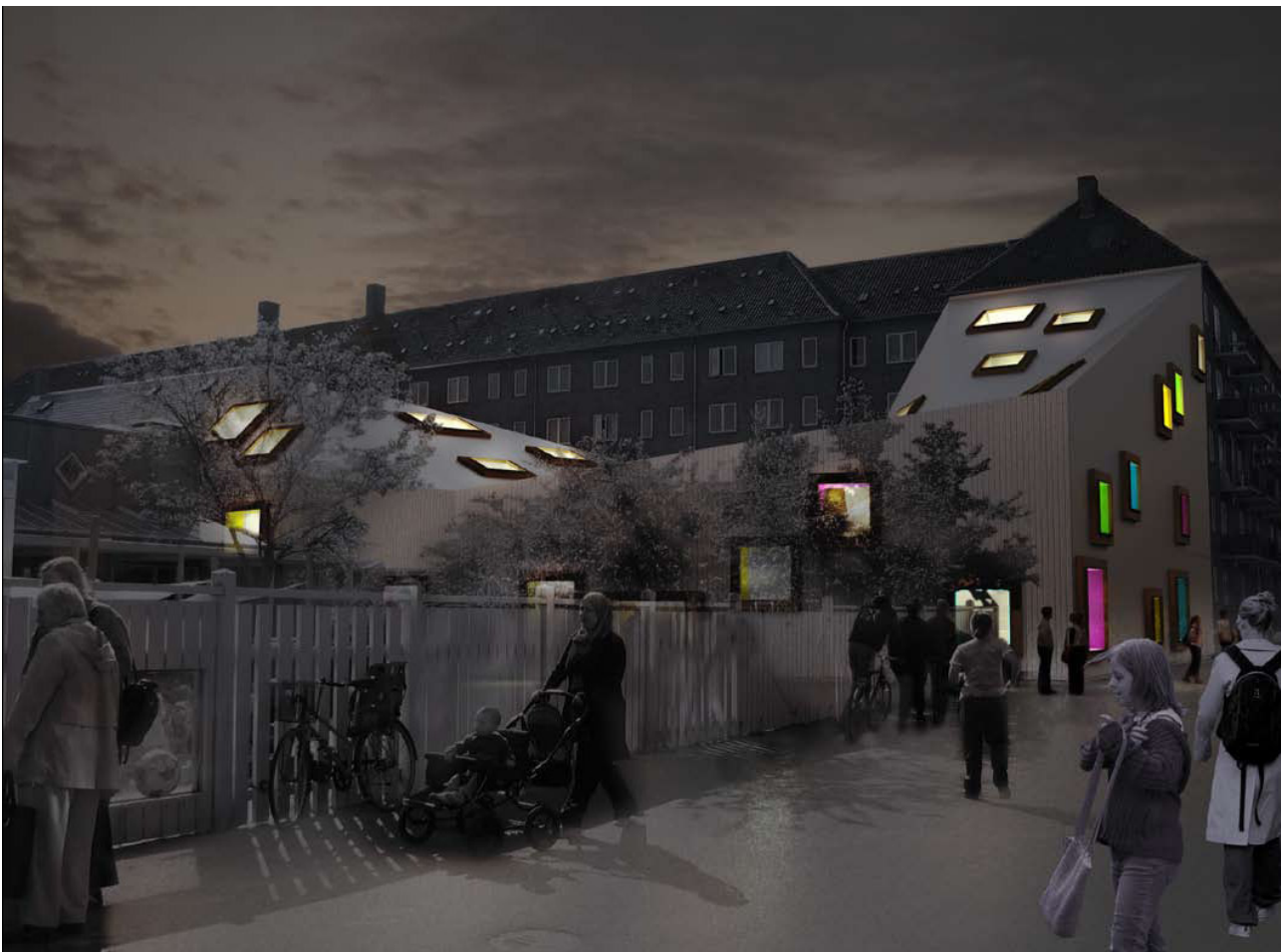
Visualisering: Bygningen i dagslys og mørke.