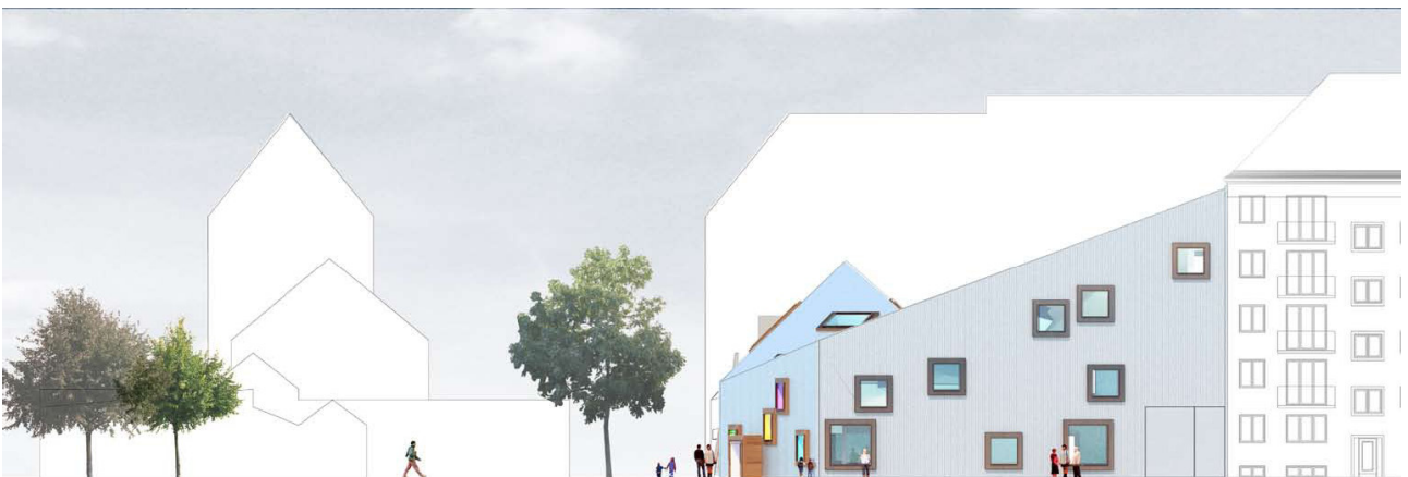
Vestfacade - mod Amager Bio