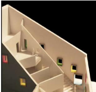
BJERET - DE STABLEDE VÆRKSTEDER MED KIG TIL HINANDEN