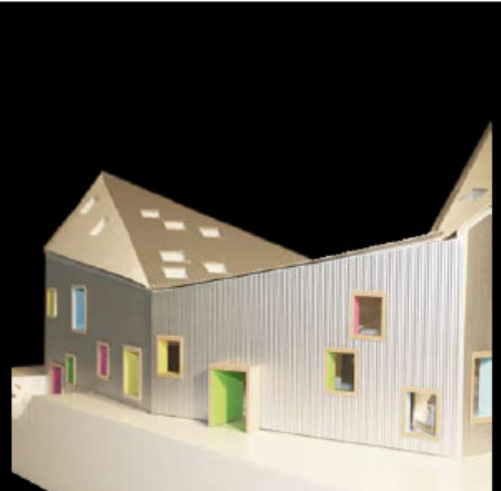
HØVEDINDGANGEN, EN INTIM INDSLUSNING TIL BØRNEKULTURHUSETS UNIVERS.