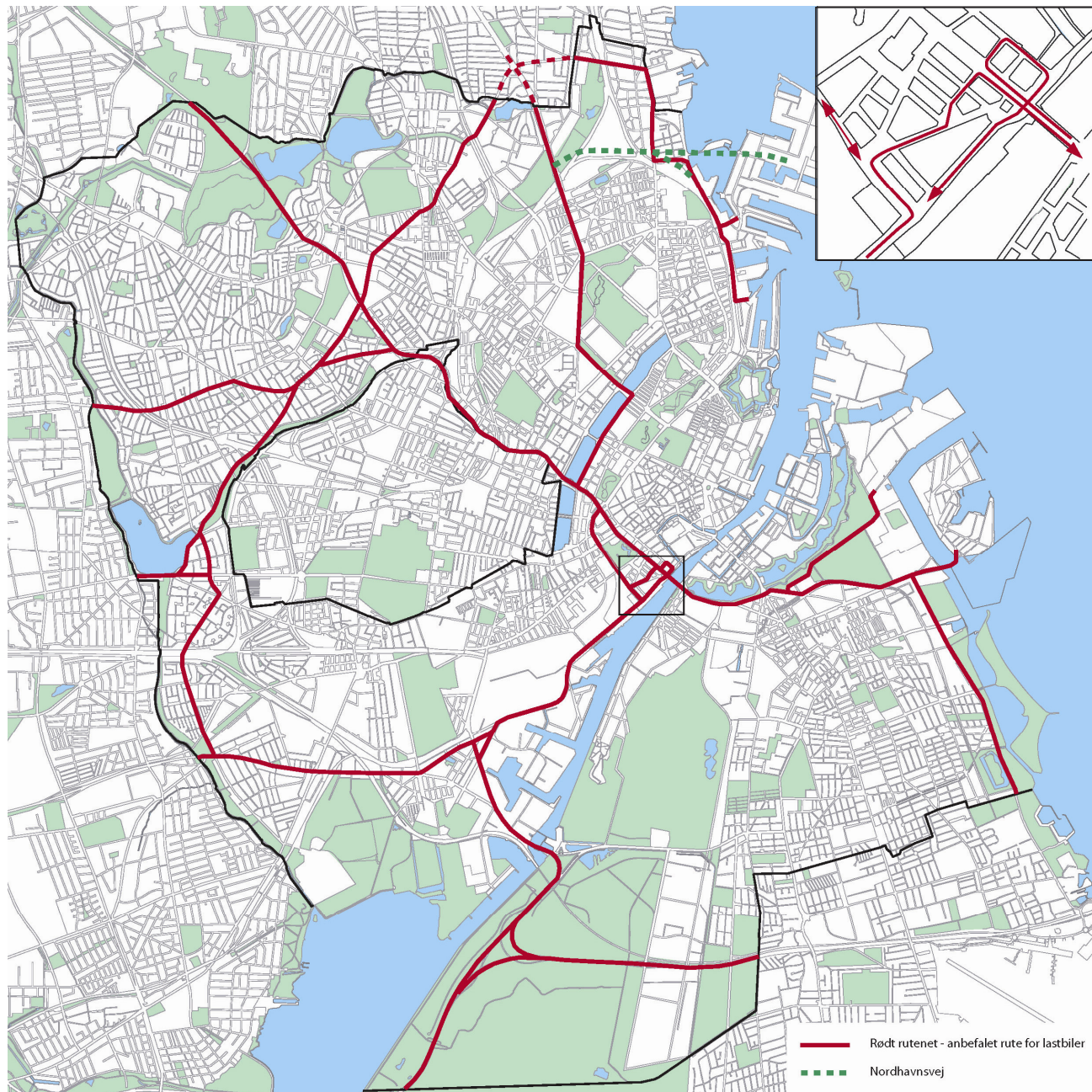
Figur 1 – Rødt rutenet

I notatet henvises til et udvalgt overordnet trafikvejnet kaldet "rødt rutenet". Dette vejnet er foreslået af Københavns Kommunes, og fremgår af nedenstående figur 1: