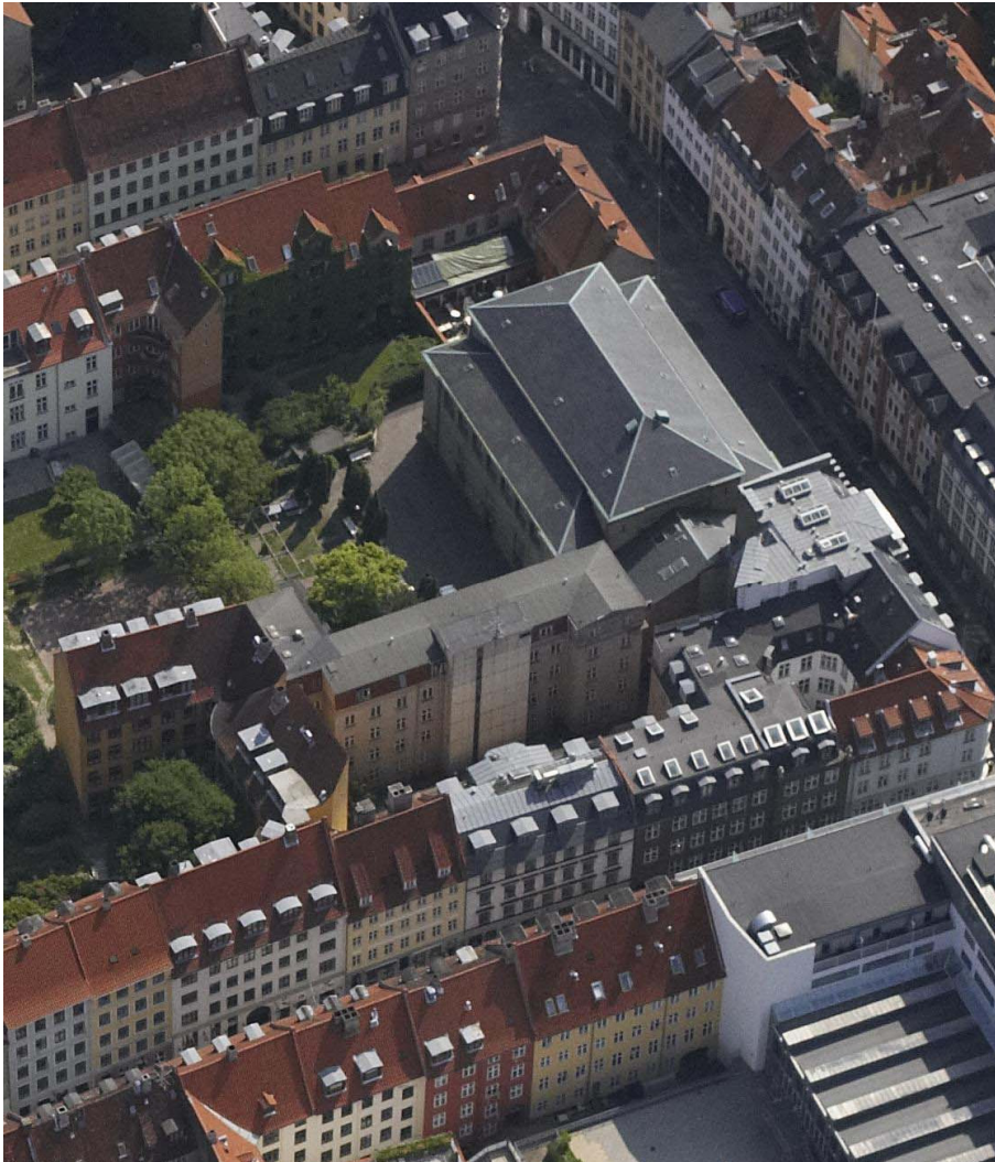
"Skråbillede" af området set fra vest med Fiolstræde i forgrunden