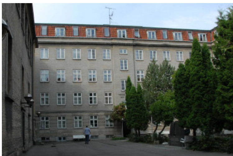
"Meyers Minde" set fra øst