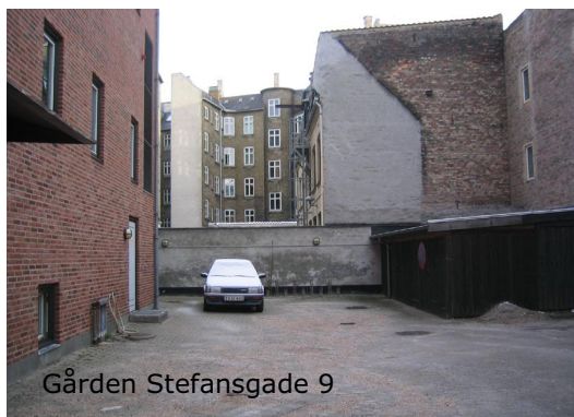
Gården Stefansgade 9