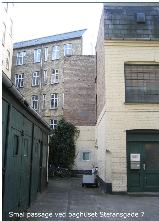
Smal passage ved baghuset Stefansgade 7

Baghuset i Sorgenfrigade 4 er en muret bygning i én etage, der forbinder forhuset med baghuset