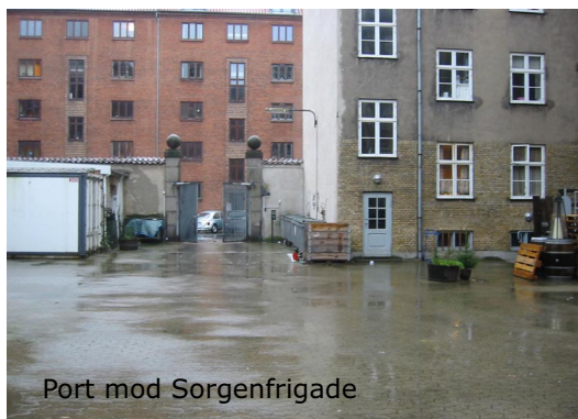
Port mod Sorgenfrigade

Stefansgade 9 har i dag adgang for kørende trafik ad en større port i Sorgenfrigade, og over ejendommen Søllerødgade 40-42/Sorgenfrigade 10. Der er dagligt tung trafik over denne del af gården, ligesom erhverv og private parkerer i de