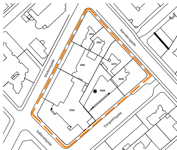
kort over Sorgenfrigade-karréen

Med dette forslag foreslås der etableret ét samlet gårdanlæg for karréen.