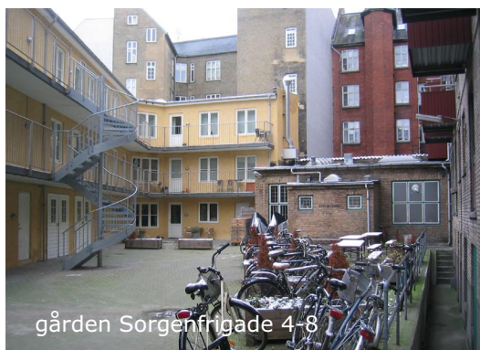
gården Sorgenfrigade 4-8