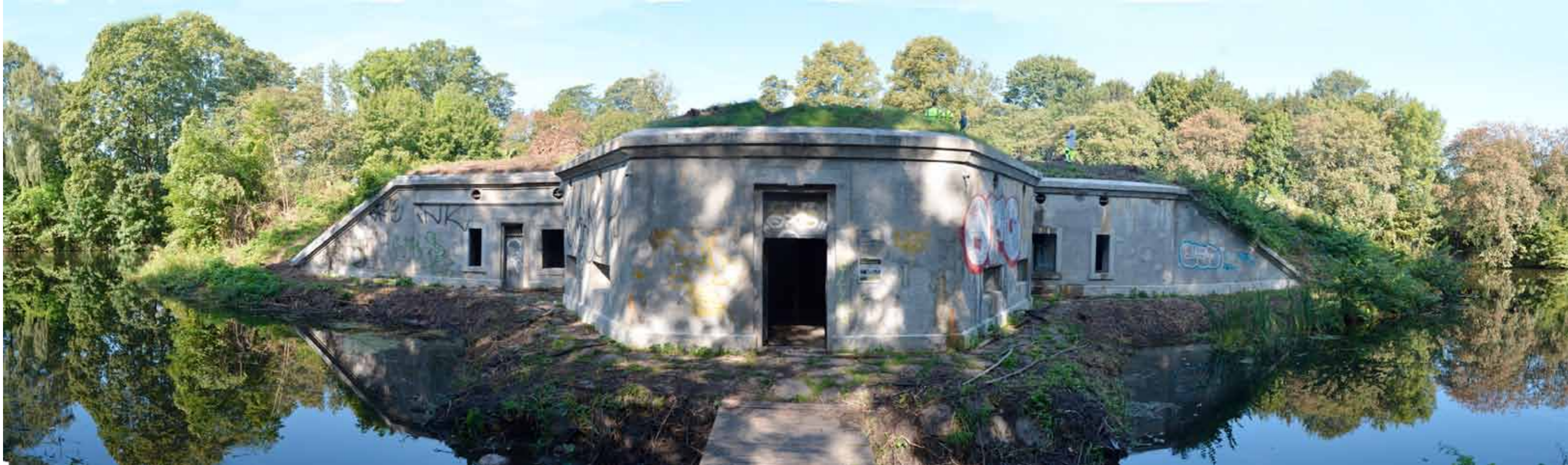
Dobbeltkaponieren efter en ordentlig omgang kratrydning og renovering.