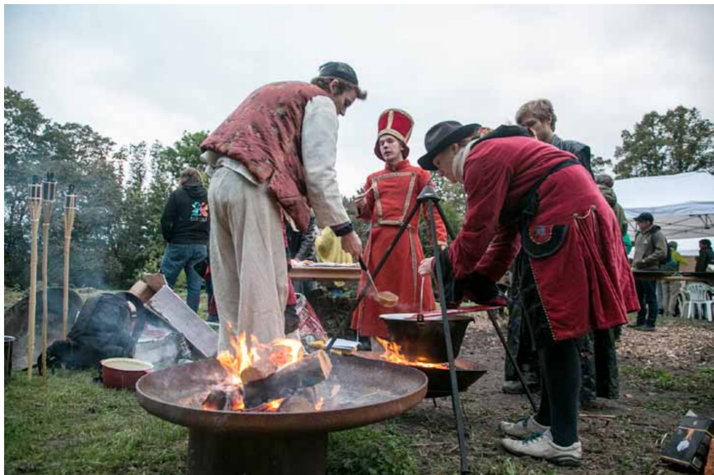
Rollespillere i gang med at servere bålmad