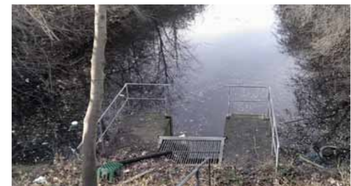
Når fæstningskanalen er renset op for sediment, grene og indkøbsvogne vil dette sted blive en rigtig god fiskeplads.

Det er Lokaludvalgets ønske at der etableres rulleskøjte egnet belægning på Voldalleen.