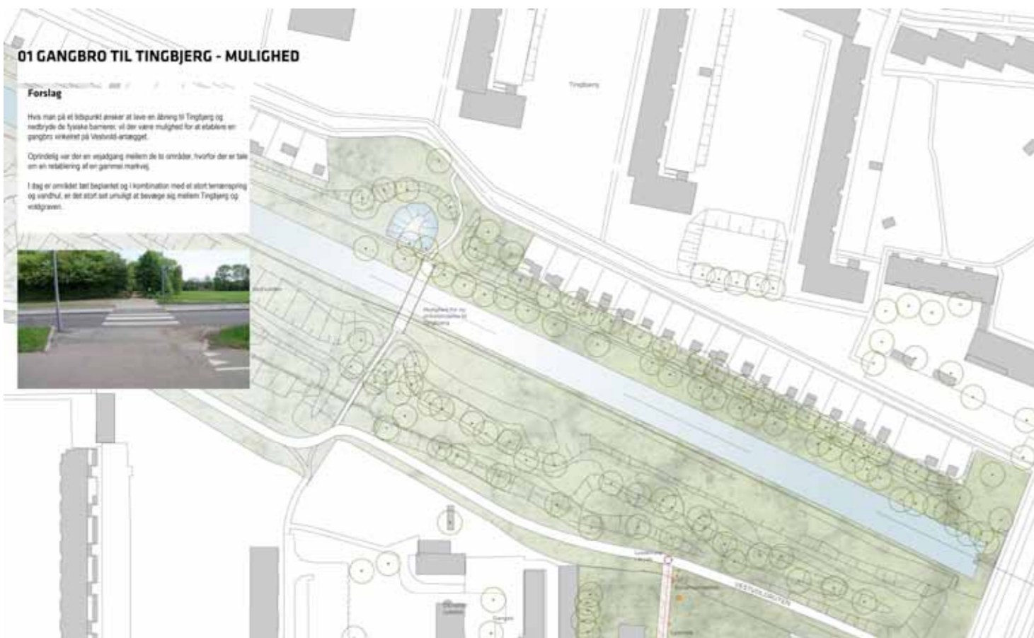
Den nordligste del af Den grønne forbindelse i Husum, hvor en ny cykelgangbro er skitseret på det sted hvor der indtil omkring 1950 lå en bro / Skitseforslag af Rambøll 2013