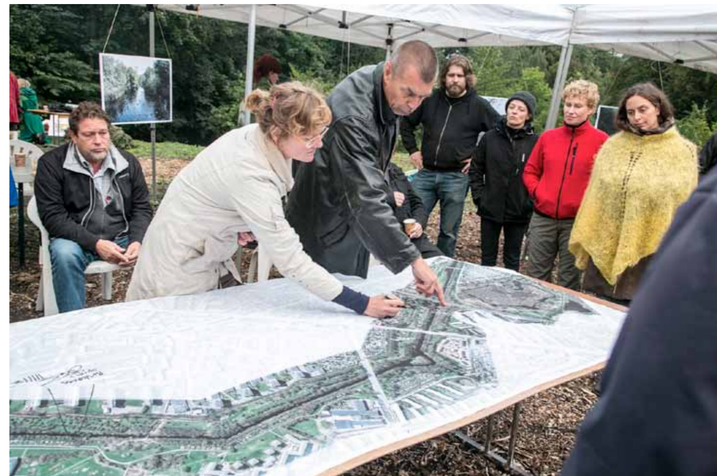
Workshop på taget af dobbelkaponieren. Borgere, embedsmænd og foreningsrepræsentanter samlet om det store kort over Husumenceinten som er det historiske betegnelse for den del af Vestvolden der løber gennem Københavns Kommune