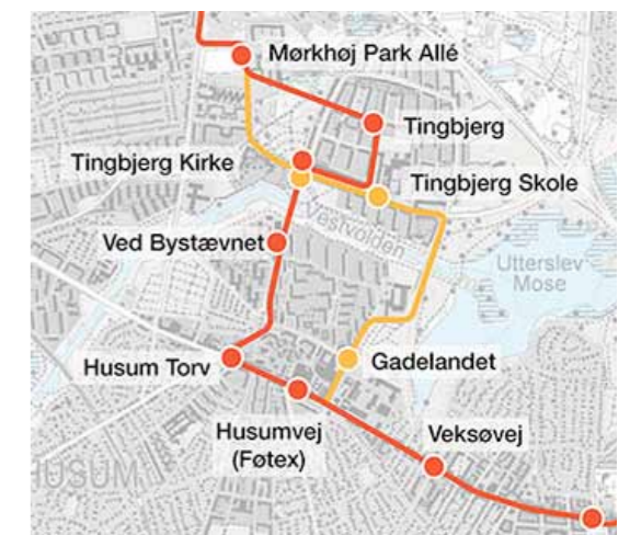
Forslag til linjeføring af letbane / Letbaner.dk

Teknik- og Miljøforvaltningen går i 2015 i gang med at projekttere den grønne forbindelse eller Husumforbindelsen som den også kaldes. Borgerrepræsentationen har besluttet at den skal anlægges i perioden 2015-2017.