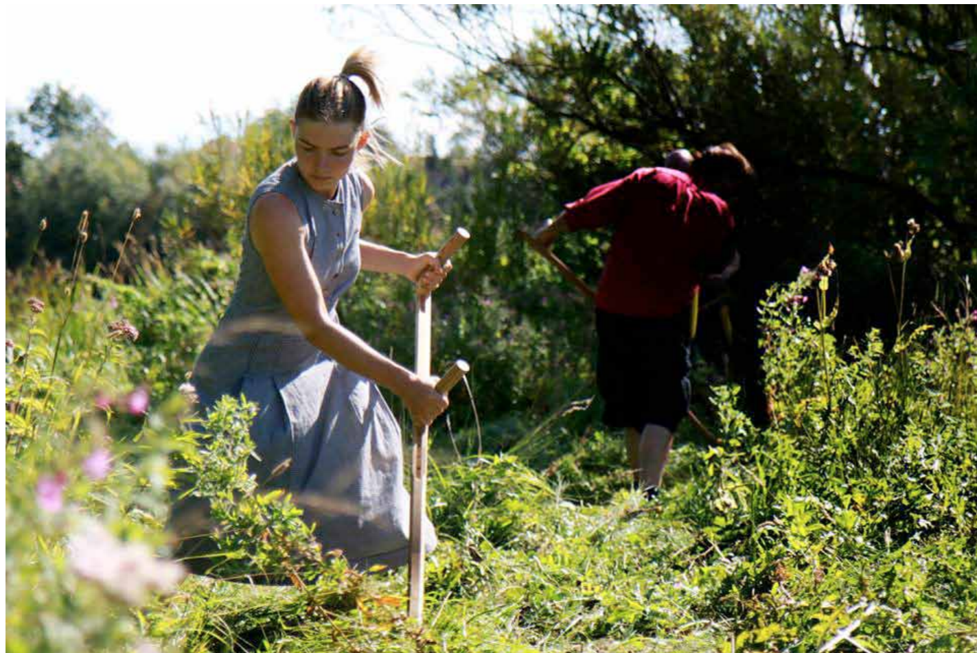
Høslæt ved Kirkemosen