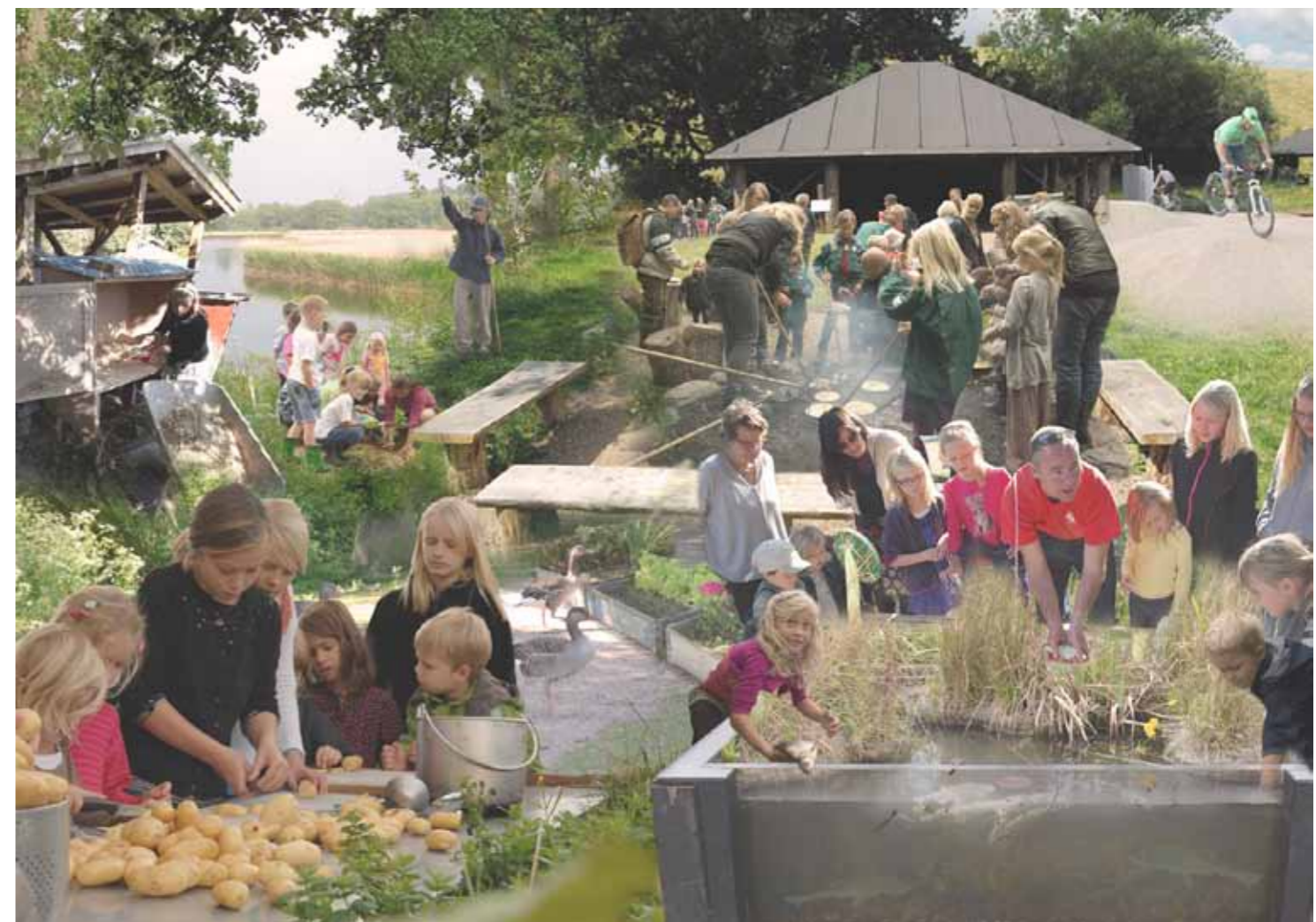
Collage: Christian Lunde

3. Øget biologisk mangfoldighed. Naturbyen skal også være et aktivt centrum for initiativer, der direkte skaber en rigere natur. Naturbyen skal være med til at vise en ny vej i forvaltningen af de bynære naturområder ved at engagere og invol-