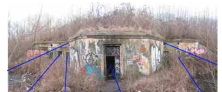
Dobbeltkaponieren før renovering (2012)

Det lokale ejerskab kan desuden sikres ved at etablere en brugerforening bestående af fx spejdere, rollespillere, lokale kulturmedarbejdere, kulturbrugere og friluftinteresserede.