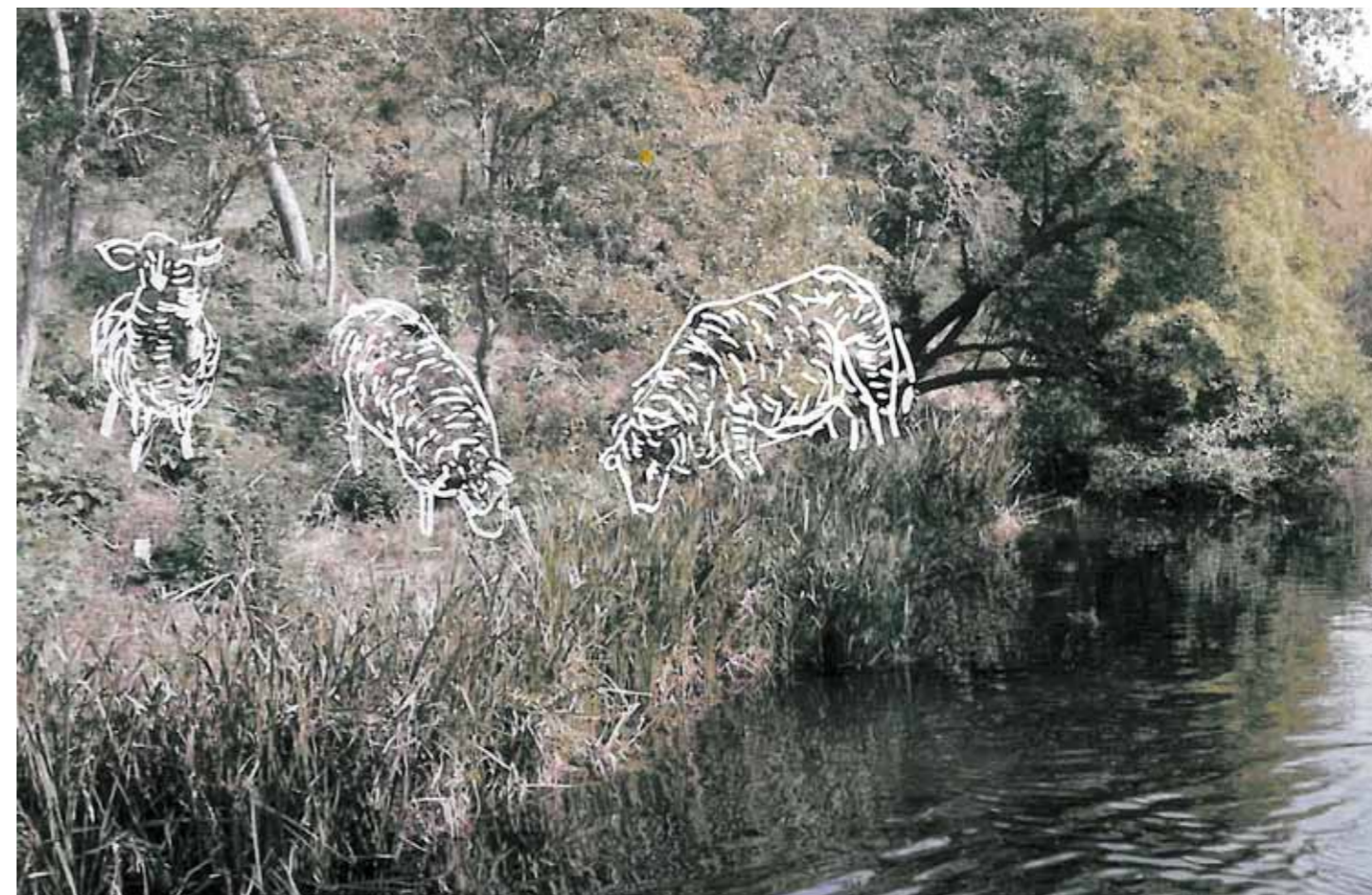
Afgræsning med får / Visualisering: Britt Boesen