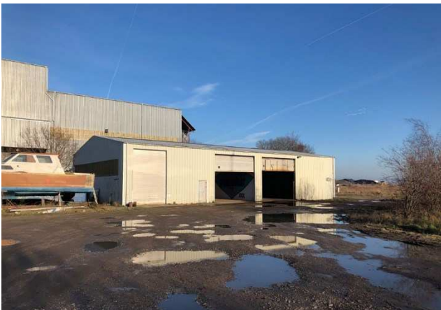
3.1 Lille hal v. Tunnelfabrikken