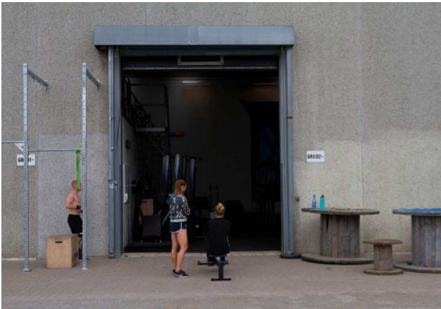
2.3 Sydfacade. Undendørsarealet kan anvendes til aktiviteter