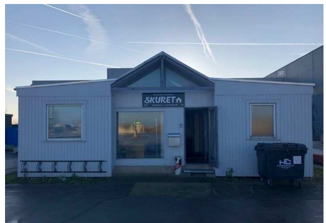
4.1 Pensionistforeningen i havnen, midlertidigt pavillonbyggeri.