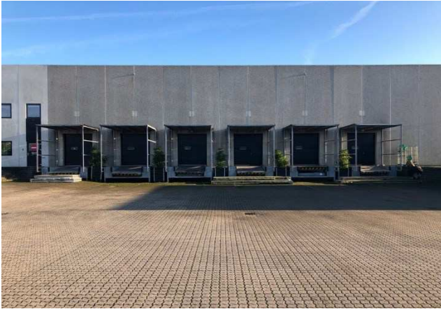
2.1 Vest facade Kattegatvej 4-6 m. karakteriske læsseramper