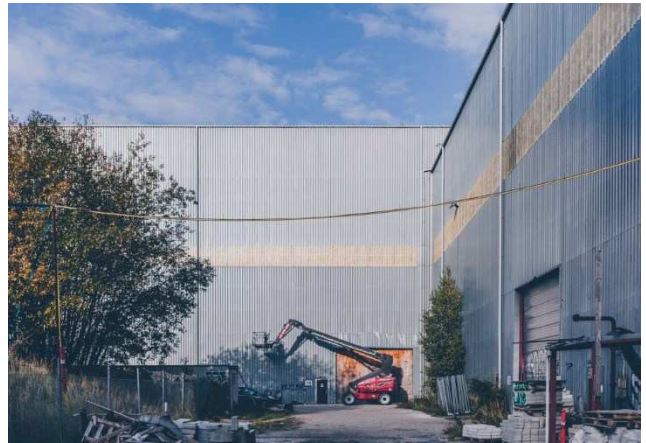
1.4 Eksisterende metalfacade