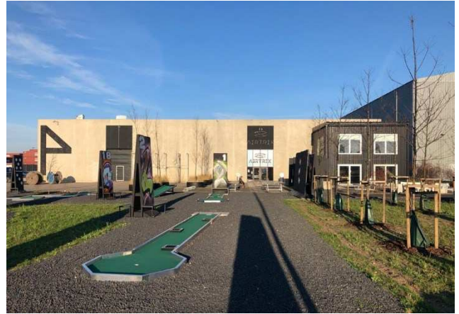
2.2 Sydfacade, Indgang Airtrix og The Little Black Cafe med udeområde med minigolf i forgrunden.