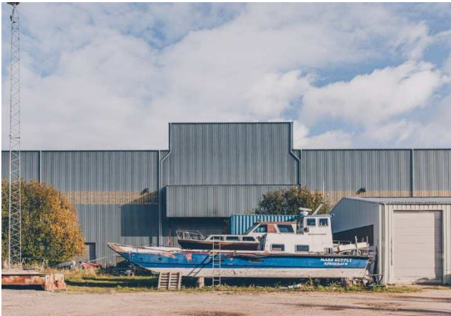
1.3 Fremspring i facade og tag. Sydfacade, Støbe- hallen