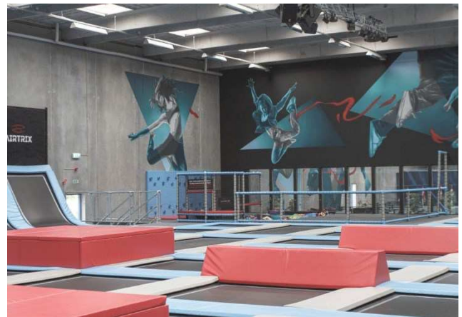
2.4 Interiør med ovenlys