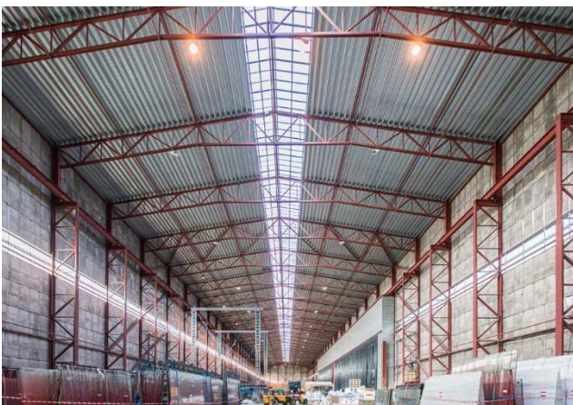
1.5 Eksisterende stålstruktur og ovenlys i Armeringshallen.