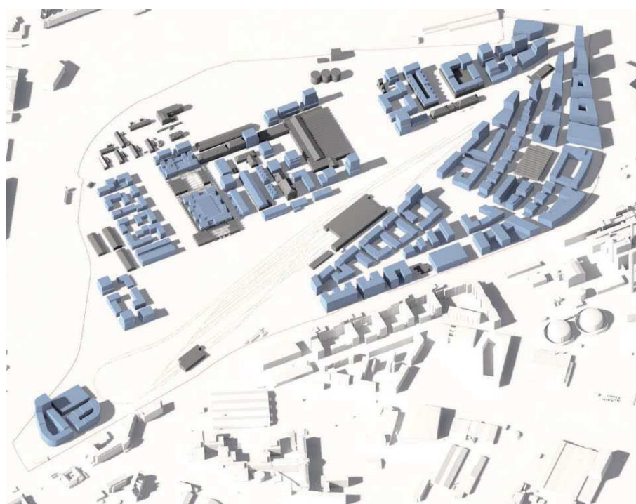
Foreløbig volumenmodel af bygherres forslag til bebyggelsesplan. Blå bygninger er nye og grå er eksisterende. Illustration: Team Cobe

Slots- og Kulturstyrelsen har udpeget en del af området til det nationale industriminde 'Jernbanen mellem København og Korsør'. Området er også udpeget som samlet værdifuldt kulturmiljø i Kommuneplan 2019 med bebyggelser af særlig kvalitet og med et bevaringsværdigt helhedspræg. Det betyder, at opførelse af