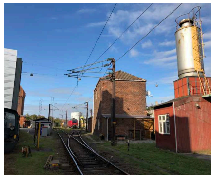
Området bærer i dag præg af togdrift. Bagerst til venstre anes vandtårnet.