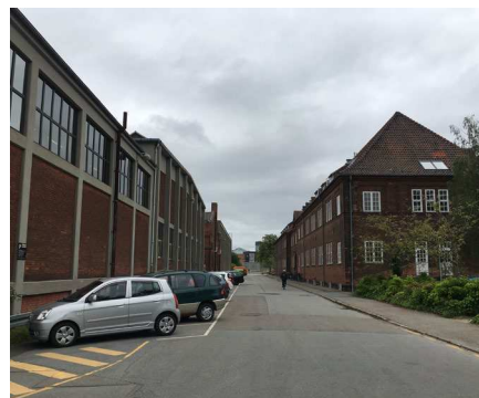
Vejforløb syd for det nye lokomotivværksted.