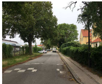
Træer langs Otto Busses Vej og udsnit af den Gule By, der bevares.

De 5 temaer understøtter 'Arkitektur der fortæller' i Københavns Kommunes arkitekturpolitik ved, at områdets kulturhistorie har inspireret til kurvede gadeforløb i syd inspireret af områdets jernbanespor, og bevaring af fysiske jernbanespor m.m. i den nordlige del. Der findes i dag ca. 98.000 m 2 etageareal eksisterende bebyggelse på det aktuelle byudviklingsareal, heraf foreslås 50-60.000 m 2 nedrevet i området som helhed, heraf ca. 15.000 m 2 i syd.