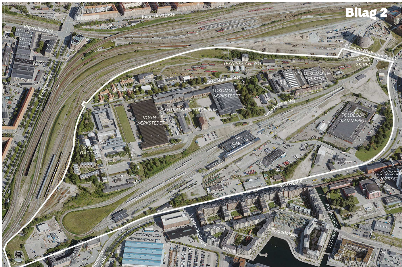
Området set mod nord. Lokalplanområdet er indtegnet med hvid linje og de vigtigste gader og bygninger er navngivet.