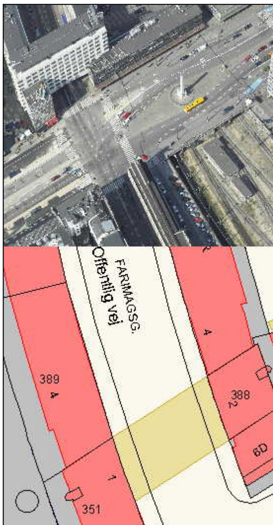
Figur 1: Bebyggelsen Buen (bemærk de grå matrikelflader under bygningerne)

rende brugsretsaf tale indgået før 1. april 1991. Den private bygningsejer er efter det oplyste interesseret i at forlænge brugsretsaf talen, når den udløber, for et længere tidsrum end 10 år, men parkeringsanlægget er beliggende på en umatrikuleret offentlig plads.