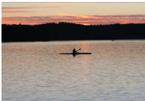
Kajak roer nyder afstemning på Bagsværd Sø

"Naturskøn, fredelig sejlads på søerne lige nord for København - ad Fæstningskanalen over Lyngby Sø til Nybro Kro og videre ud på Bagsværd Sø, hvor der lægges til ved Sophienholm, Bagsværdvej, Aldershvile og Regatta Pavillonen. Herfra returneres til Sophienholm, Nybro Kro og Lyngby." Således er der at læse i en nutidig reklame for Bådfarten. Da bådfarten i 1976 blev overtaget af kommunerne omkring Furesøen, Lyngby Sø og Bagsværd Sø, havde den allerede sejlet på søerne i over 80 år og var blevet en institution, som ingen ville undvære. Bådfartens popularitet hos Storkøbenhavns befolkning og hos hovedstadens turister fremgår af, at den - bortset fra Københavns Havnerundfart og selskabet "Hjejlen" på Silkeborg-søerne - er den største af sin slags i Danmark. Bådfarten har i dag seks motorbåde, hvoraf de fire besejler Lyngby Sø, Bagsværd Sø og Mølleåen, og de resterende to både besejler Furesøen og Vejlesø. Der sejles i sæsonen fra maj til september i fast rutefart på de fire ruter. De to ældste af bådene "Prinsesse Alexandrine" og "Prins Christian" er bygget i henholdsvis 1895 og 1896 og har således været med fra starten. De har sejlet med damp, benzin, gasgenerator og nu med diesel.