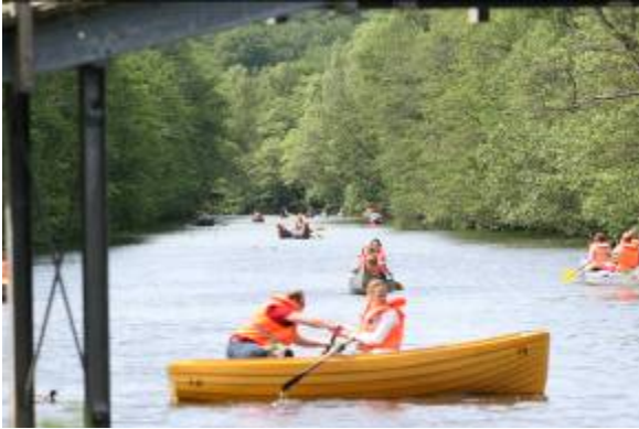
Stor aktivitet i Fæstningskanalen ved Nybro bådudlejning.