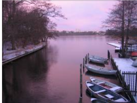
Vintermorgen på isdækket Lyngby Sø set fra Havnen.

Aldersvile Skov er en såkaldt "hundeskov", hvor hunde må løbe løs. Det gør skoven til et populært mål for vandreturen hos mange andre end de omkringboende. Herudover er rollespil, kælkning og kørsel på mountainbikes nogle af de mange aktiviteter, der foregår i Aldersvile Skov.