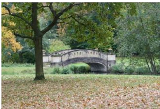
Parkens broer bruges ofte som kulisse for bryllupsbilleder