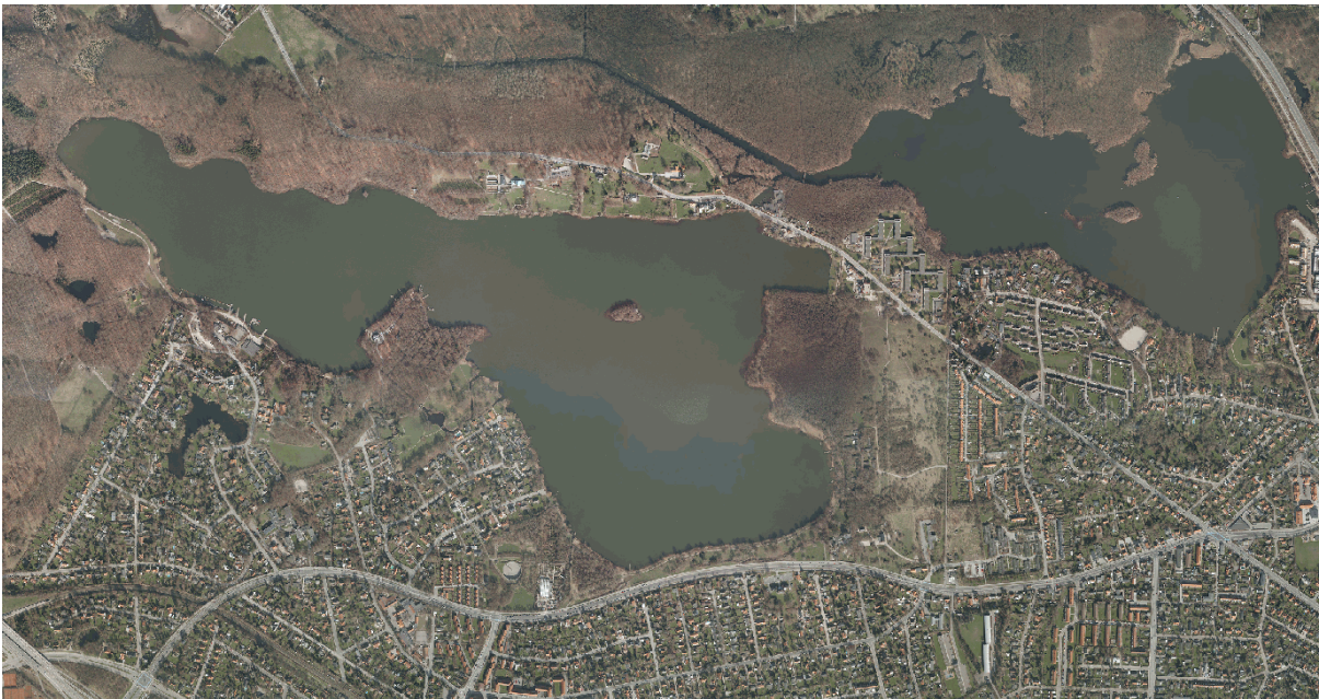
Luftfoto af Bagsværd Sø og Lyngby Sø.