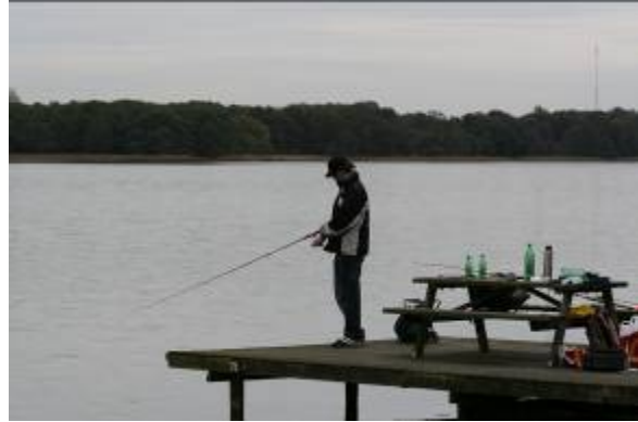
Fiskeri på Aldersvilepynten i Bagsværd Sø.

Udlejning af både foregår bl.a. ved Nybro og Frederiksdal. Udlejningen sker både til lystfiskere, motionister og folk der blot ønsker en stille sejltur på søerne.