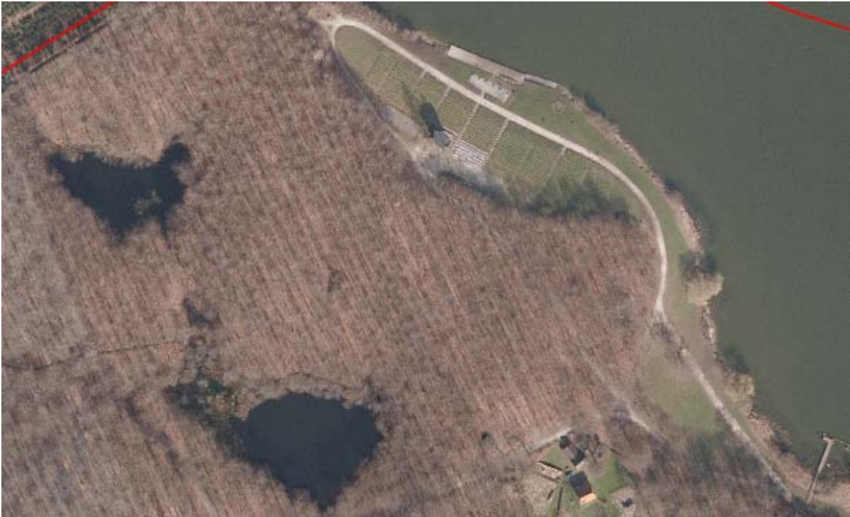
Luftfoto af tilskuerområdet i målområdet og Kobberdammene.