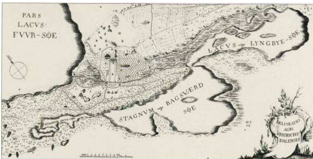
Tegning af Frederiksdals omgivelser fra Müllers værk Flora Frødrichsdalina 1767.

Kobberdammene i Bøndernes Hegn er gamle tørvegrave, som leverede tørv til såvel Aldershvile som til borgerne i København fra ejendommen Højgård. De tre søer ligger på linie smukt "gemt" i Aldershvile Skov i området ved foden af Højnæsbjerg nær Bagsværd Sø.