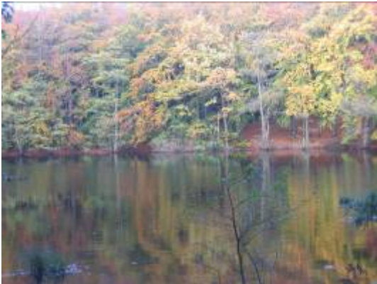
Efterårsfarvernes rødlige skær har måske lagt navn til Kobberdammene.