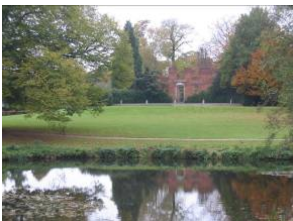
Aldershvile Slotspark i engelsk havestil.

Parken og slottet blev købt af kommunen i 1927, og i 1973-76 blev ruinen delvis istandsat og fredet som jordfast fortidsminde. I 1993 har slotsruinen med omgivelser gennemgået en større renovering.