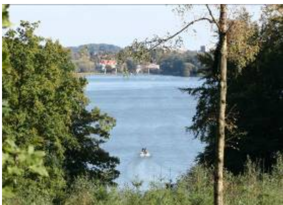
Bagsværd Sø set fra vest på en bakke i Aldershvile Skov. I forgrunden ses en af rospøtens katamaranbåde

Bagsværd Sø er på 119 ha og er afgrænset af Frederiksdal Skov, Bøndernes Hegn og Aldershvile Skov mod nord og vest. Mod syd afgrænses søen af flere kultiverede parkområder bl.a. Aldershvile Slotspark og den fredede Bagsværd Søpark samt af villabebyggelse. Mod øst afgrænses søen af ellesump ved Radiomarken, som er også er fredet. Ellesumpen er som det eneste område i Gladsaxe Kommunes rapport fra 2007 "Vandområder i Gladsaxe Kommune" karakteriseret som værende af national betydning. Midt i søen ligger øen Gåseholm.