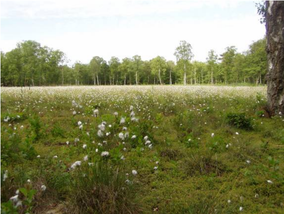
Tue-Kæruld i Lyngby Åmose, hvor en omfattende naturpleje siden 1950'erne har forhindret, at området er groet til.