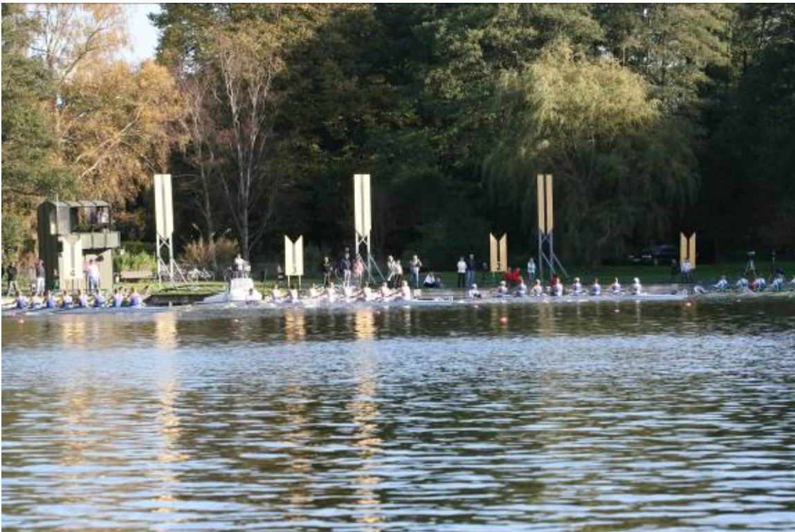
Starten på et "otter"-løb. Startområdet er 1930'erne gravet delvis ind i den nu fredede ellesump ved Radiomarken.

Bagsværd Sø med omgivelser har imidlertid været under et stigende pres fra både rosporten og grundejere omkring søerne. Der har bl.a. været overvejelser fremme om at udbygge det eksisterende rostadion på Bagsværd Sø og flere grundejere har ønsket tilladelse til byggeri nord for Bagsværd Sø. Det er sagsrejsers ønske, at de eksisterende rosportsfaciliteter i og omkring søerne fortsat kan udnyttes og forbedres, men at det må ske uden at forringe områdets landskabelige, naturmæssige, kulturhistoriske og rekreative værdier.