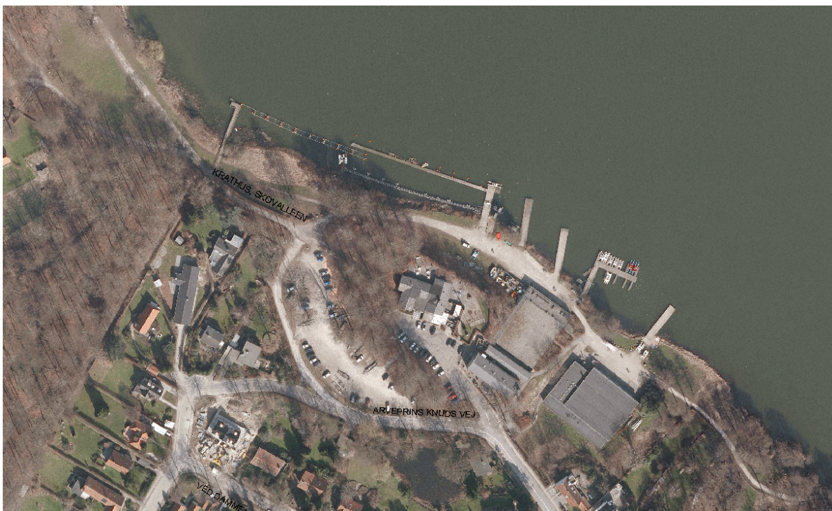
Luftfoto af Regattaområdet med roklubber og kajanlæg.