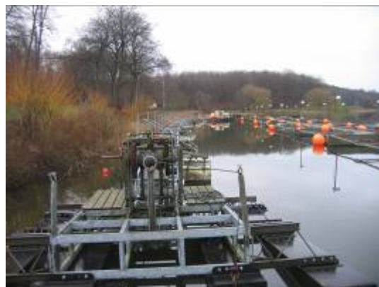
Udstyr ved Bagsværd roklubberne i Regattaområdet med tilskuer pladserne i baggrunden.

Danmarks Naturfredningsforening tog på den baggrund i 2006 initiativ til et samarbejde med de tre involverede kommuner, Gladsaxe, Lyngby-Taarbæk og Værløse (nu Furesø) om udarbejdelse af dette fredningsforslag. Samarbejdet har resulteret i, at alle tre kommuner er positive overfor en fredning, men at Furesø Kommune og Lyngby-Taarbæk Kommune indtil videre overvejer at være medrejsere på fredningssagen, mens Gladsaxe Kommune på enkelte punkter er uenig i fredningsforslaget. Det er baggrunden for at ingen af kommunerne indtil videre har ønsket at være medrejsere på fredningssagen. Undervejs har DN holdt adskillige møder med de tre kommuner, hvorunder også en repræsentant fra Danmarks Idræts-Forbund har deltaget, således at deres synspunkter er sagsrejser bekendt.