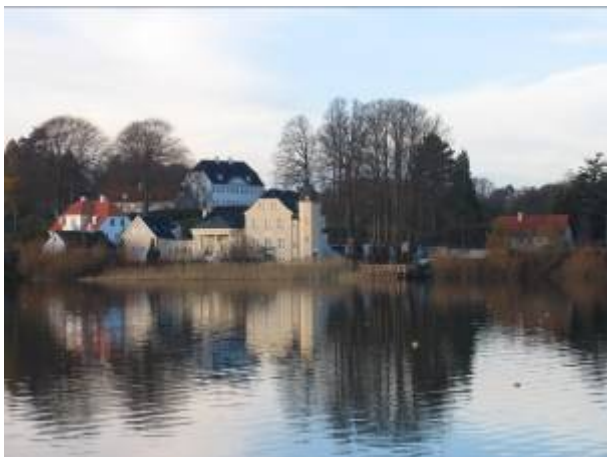
Villa Tusculum med statsministerboligen Marienborg i baggrunden.

indboet til staten. Den trelængede ejendom med tilhørende tjenestebolig bruges i dag primært til møder, middage og officielle sammenkomster med statsministerparret som værter. I enkelte perioder har Marienborg dog også fungeret som egentlig privatbolig for statsministeren.