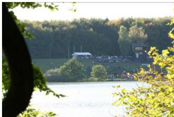
Tilskuerpladserne i målområdet, som ligger i Aldershvile Skov lige op til Kobberdammene

Frederiksdal Skov er stærkt kuperet ned til Bagsværd Sø, og indgår ikke i fredningsforslaget, da den allerede er fredet, og da der ikke vurderes at være behov for en modernisering af fredningen.