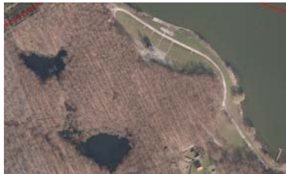
Tilskuerområdet i målområdet og Kobberdammene.

Ved Kobberdammene er der bl.a. fundet en række padder og krybdyr, herunder spidssnudet frø og stor vandsalamander, som er på EF-habitatdirektivets bilag IV. Området karakteriseres som værende af regional værdi. Området karakteriseres i Gladsaxe Kommunes rapport "Vandområder i Gladsaxe Kommune 2007", som havende stor landskabelig værdi der indgår som et vigtigt vådområde i Hareskoven.