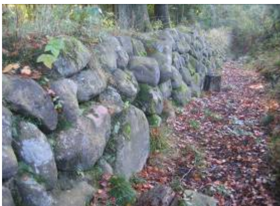
Holmskjolds stendige i Aldershvile Skov