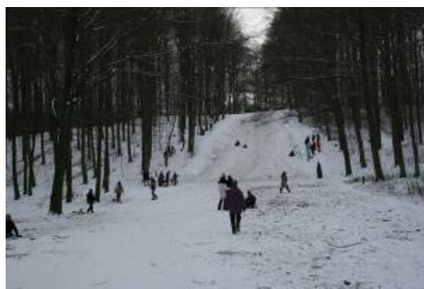
Kælkebakken Højnæsbjerg i Aldershvile Skov. Kælkebakkens historie går tilbage til 1915