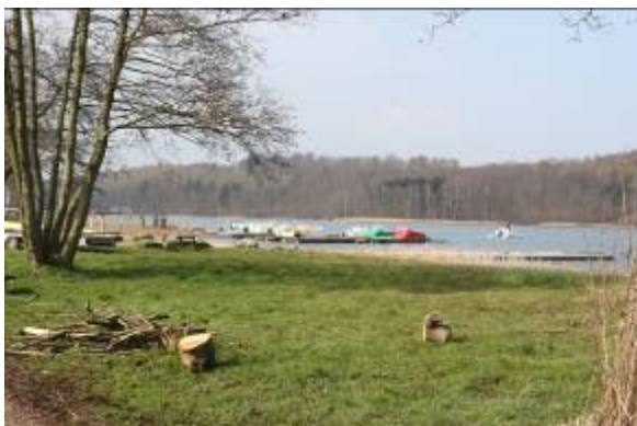
Kajanlæg for 25 katamaraner ved Bagsværd roklubberne i Regattaområdet

Aldershvile Skov og Bøndernes Hegn er statsskove, mens de åbne arealer vest for Bøndernes Hegn er privatejede. Ud over store landskabelige værdier, rummer området en meget spændende kulturhistorie som bør beskyttes og formidles. Med fredningen skabes adgang til at sikre pleje af området, forbedret offentlig adgang og en bedre beskyttelse imod byggeri og anlæg.