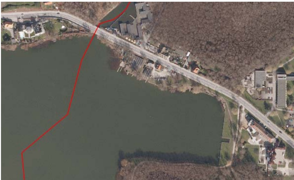
Luftfoto af startområde. Øverst i billedet ses i Nybro-Furå Kano- og Kajakklub.