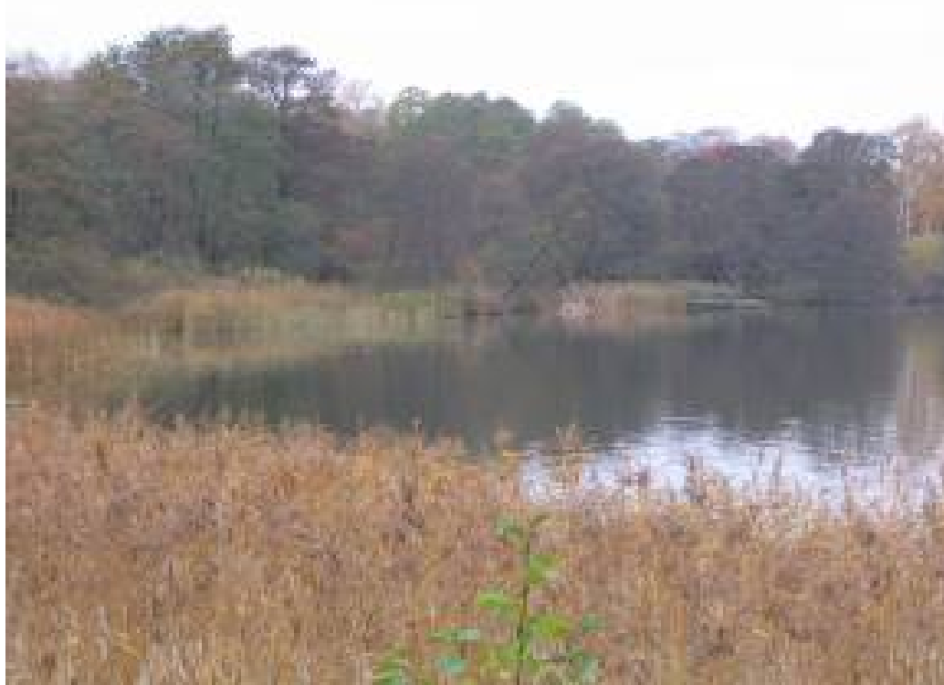
Ved Bagsværd Søes sydlige bred vokser skoven nogle steder helt ud i vandkanten.

Spildevandsforureningen er nu ophørt bortset fra overløb fra kloaknettet med fortyndet spildevand ved kraftig nedbør. Søernes bundslam indeholder imidlertid store depoter af især fosfor, som er årsagen til, at vandkvaliteten i søerne stadig er meget ringe med uklart vand og kraftig algevækst.