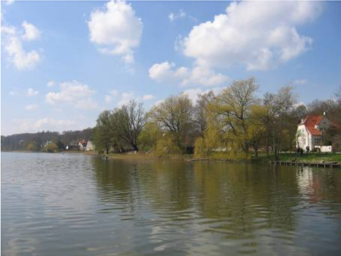
Foto af området ved Nybrovej, som i dag er fredet af en udsigtsfredning fra 1954.

Af væsentlige fredninger umiddelbart udenfor fredningsområdet skal nævnes: