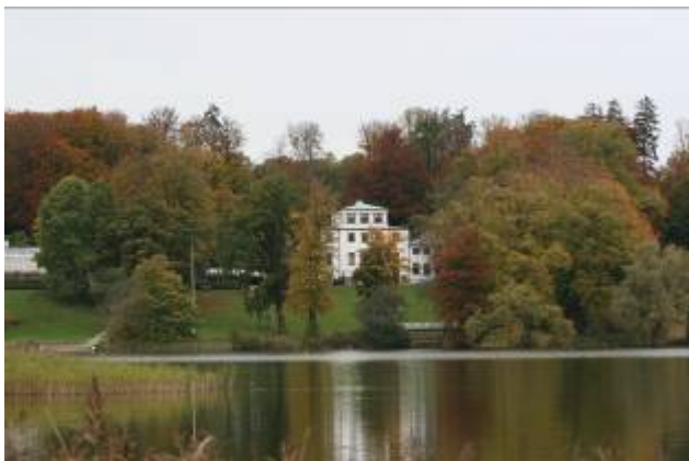
Sophienholm er i dag et vigtigt kulturcentrum i Lyngby-Taarbæk Kommune