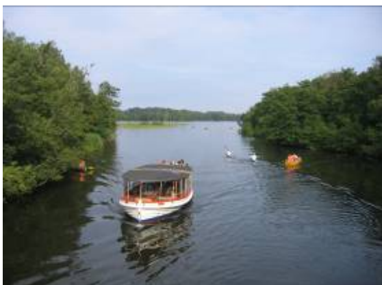
En af bådfartens motorbåde på vej ind befæstningskanalen fra Lyngby Sø mod Frederiksdal

Lyngby Sø og Bagsværd Sø med omgivelser har været præget af friluftsliv og rekreation i mere end 100 år. Bådfarten, bådudlejningerne, Frederiksdal, Aldershvile og Sophienholm har bidraget kraftigt hertil.