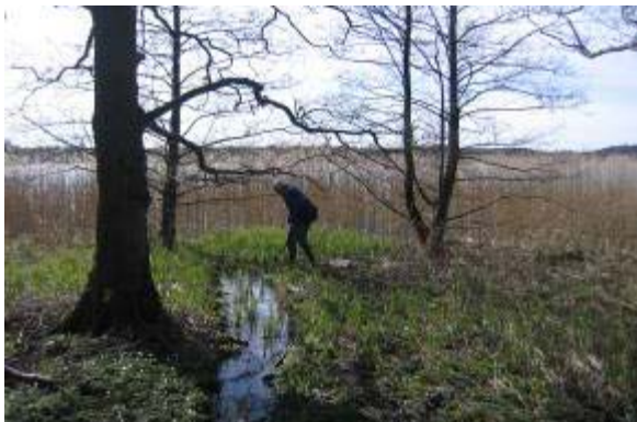
I april 2007 registreres sumpvindelsnegl for første gang ved Bagsværd Sø af Kaare Fog

Efter Naturbeskyttelseslovens § 36 stk. 3 og 4 skal fredningsforslag uden for internationale naturbeskyttelsesområder redegøre for, at fredningen ikke forringer naturtyper og levesteder for arter eller forstyrre arter inden for et internationalt naturbeskyttelsesområde, som området er udpeget for.