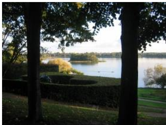
Udsigten fra Sophienholm.