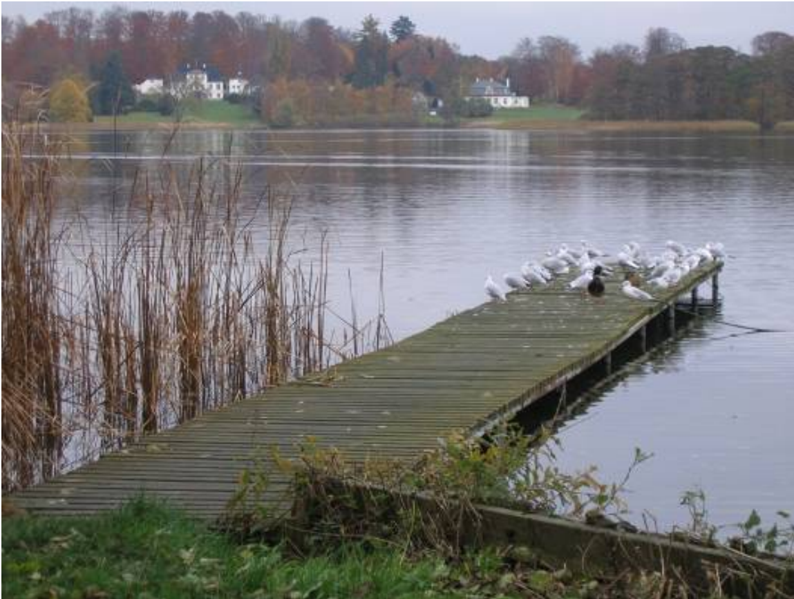
Bagsværd Sø's nordøstlige bred er domineret af store landsteder.