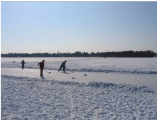
Vinteraktiviteter på Lyngby Sø, da den milde vinter i 2006 pludselig ændrede karakter midt i marts måned.

Udlejning af både foregår bl.a. ved Nybro og Frederiksdal. Udlejningen sker både til lystfiskere, motionister og folk der blot ønsker en stille sejltur på søerne.