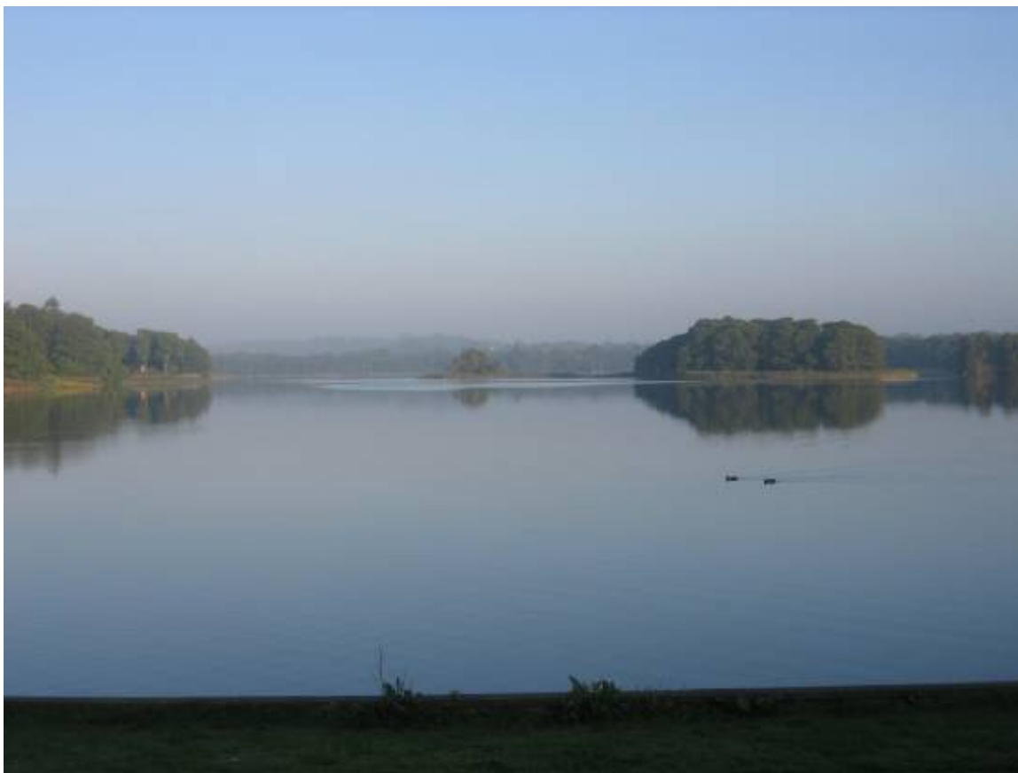
Lyngby Sø set i morgendis mod vest fra Folkeparken

Både Bagsværd Sø og Lyngby Sø har behov for naturgenopretning for at opfylde målsætningen i regionplanen, og så de igen kan blive klarvandede søer med en rig undervandsvegetation og et alsidigt dyreliv.