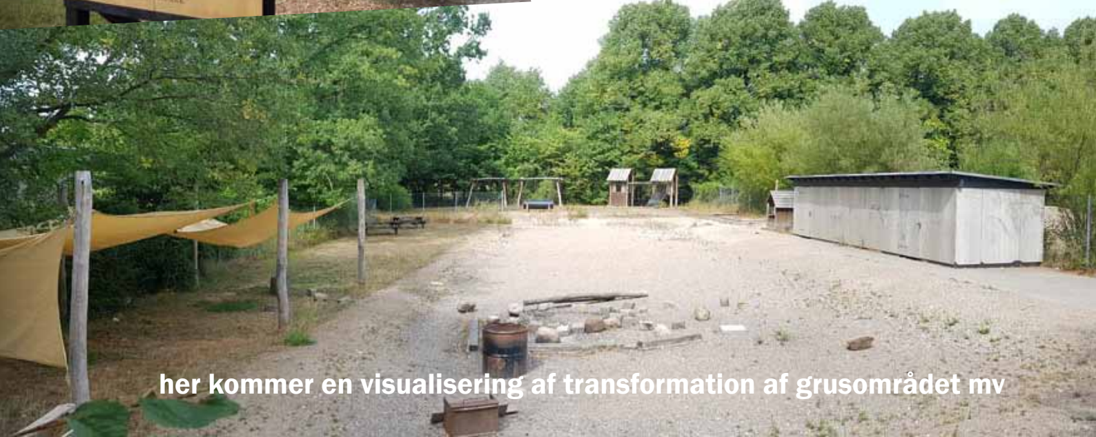
her kommer en visualisering af transformation af grusområdet mv