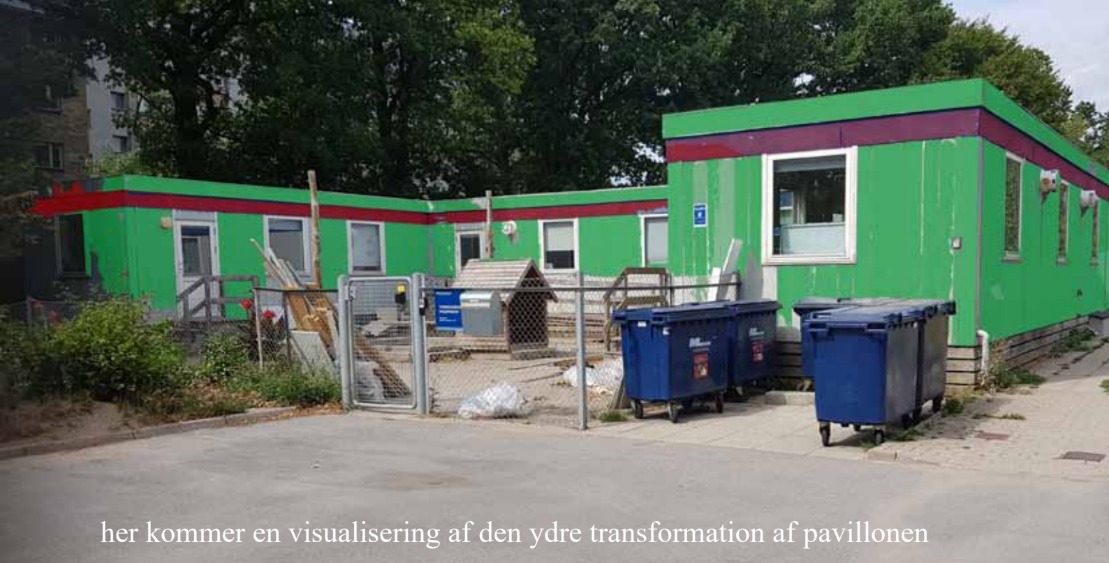
her kommer en visualisering af den ydre transformation af pavillonen

Området ligger i et beskyttet område og der vil derfor være tale om midlertidige faciliteter. Det er der en god pointe i. Vi gør os nemlig ikke nogen illusion om at vi på forhånd ved hvordan Naturbyen skal se ud i sin endelige form. Men vi vil gennem næste toårige fase systematisk og inddragende arbejde med at udforme planerne for hvordan vi kommer videre med at realisere visionerne om at skabe en ny form for bynaturcenter der kan skabe livskraftige sammenhænge mellem arbejdet for en rigere bynatur og menneskers hverdagsliv.