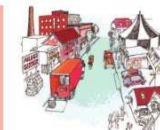
Illustration: Tineodd Tegner

Lokaludvalget arbejder i med samarbejde med lokale aktører og forvaltning, så vi kan skabe bedre rammer for ophold, gennemgang og sportsture møder på Vanløses mest centrale pladser, så der er plads til alle