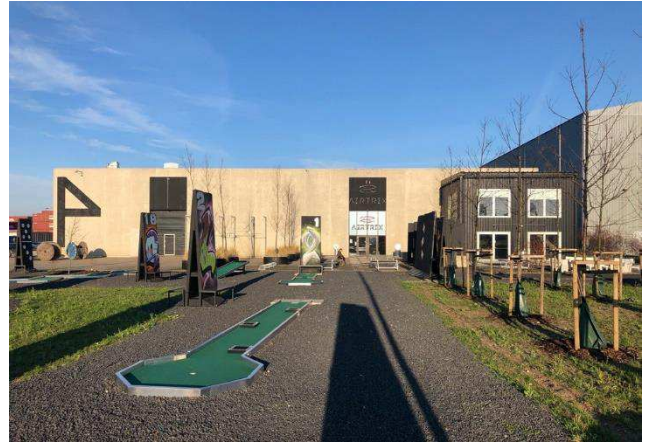
2.2 Sydfacade, Indgang Airtrix og The Little Black Cafe med udeområde med minigolf i forgrunden.