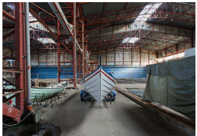
1.6 Eksisterende stålstruktur, Støbehallen