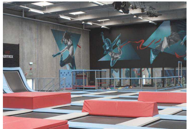
2.4 Interiør med ovenlys