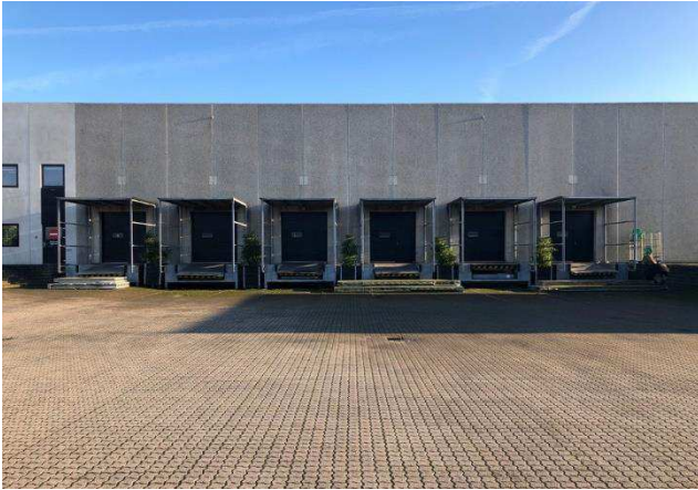
2.1 Vest facade Kattegatvej 4-6 m. karakteriske læsseramper