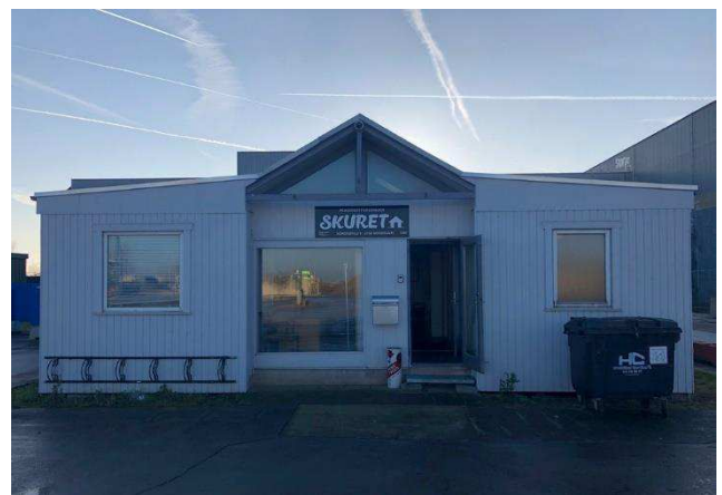
4.1 Pensionistforeningen i havnen, midlertidigt pavillonbyggeri.