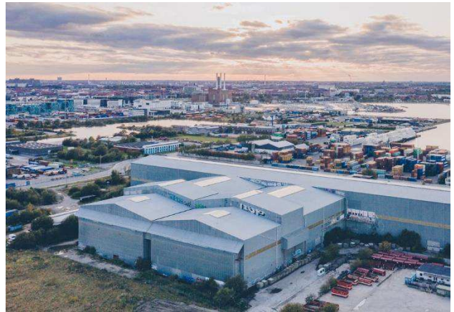
1.2 Relation til omgivelser