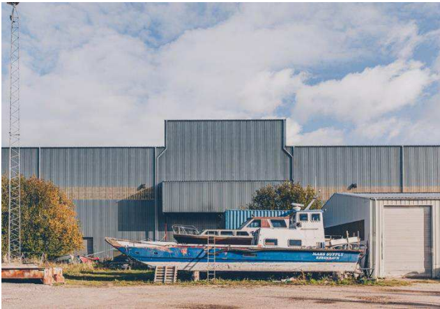
1.3 Fremspring i facade og tag. Sydfacade, Støbe- hallen