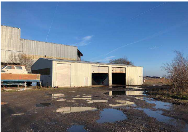
3.1 Lille hal v. Tunnelfabrikken