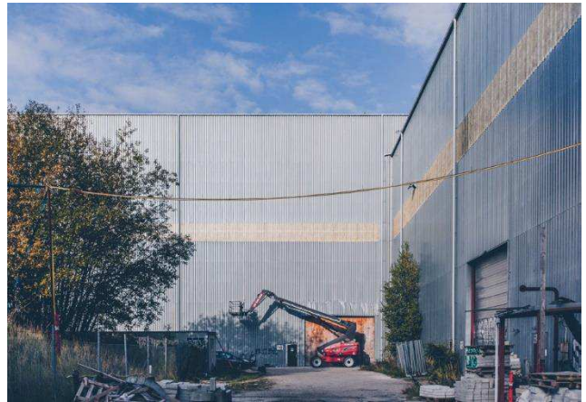
1.4 Eksisterende metalfacade