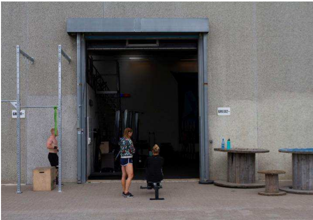
2.3 Sydfacade. Undendørsarealet kan anvendes til aktiviteter