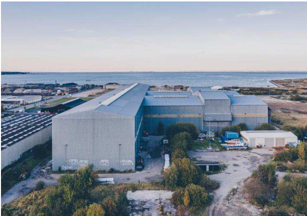
1.1 Gavlmotiv, taghældning