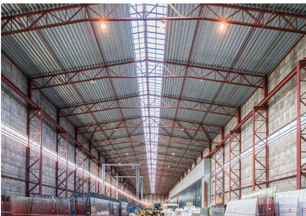
1.5 Eksisterende stålstruktur og ovenlys i Armeringshallen.