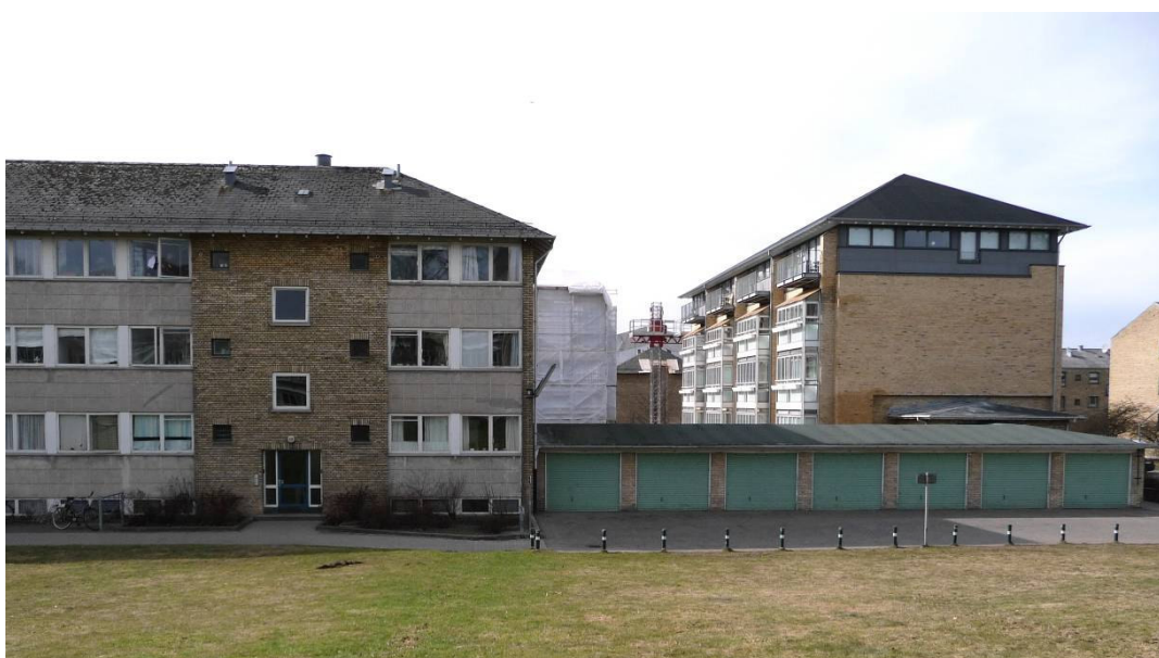
Eksisterende og fremtidige forhold - tv. ses den nordlige ende af blok D. Den istandsættes ved 2. etape. Th. ses blok C, som er næsten færdig, med ny tagetage, karnapperne mod syd mangler at blive bygget sammen med tagbolig altanerne. I baggrunden imellem blok D og C ses stilladset rundt om blok A og B, hvor arbejdet pt. pågår. Foto taget den 24. marts 2010.

Her etableres en nye tage med 5 nye boliger – 2 stk. 2 rums på 81 m 2 og 3 stk. 3-4 rums på 100 - 109 m 2 , i alt 483 m 2 . I den eksisterende del af bygningen udføres lejlighedssammenlægninger og istandsættelse. Efter sammenlægningerne vil der være 6 stk. 2 rums på 69 m 2 , 6 stk. 3 rums på 86 m 2 og 6 stk. 3 rums på 92 m 2 . I eksisterende og sammenlagte lejligheder udskiftes køkkener. Blok E's samlede areal udgør efter om bygningen ca. 1956 m 2 . Der udføres ikke elevatorer i denne blok.