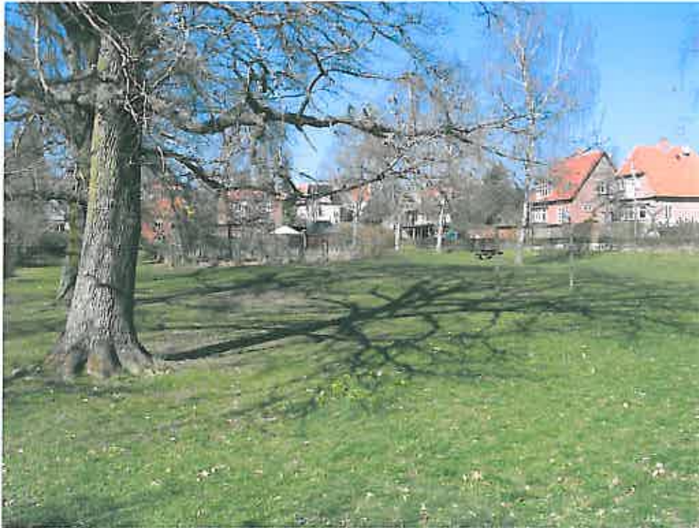
Enemærket, 2400 København NV