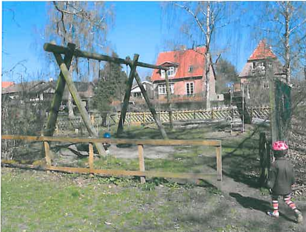
ksisterende legeplads, Enemærket, 2400 København NV