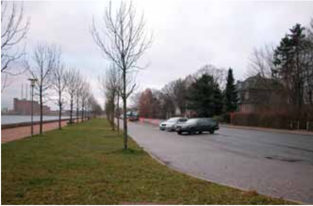
Strandpromenaden set mod syd med lokalplanområdet til højre i billedet.