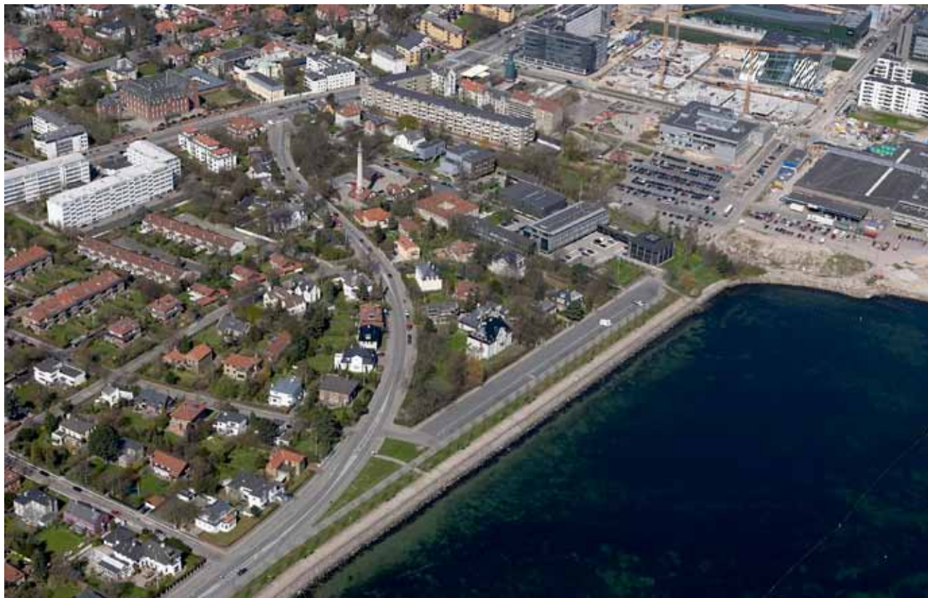
Luftfoto af området set mod nordvest.