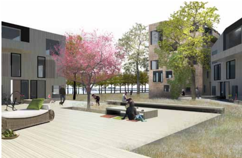
Gårdrum i bebyggelsen med blik mod Øresund.