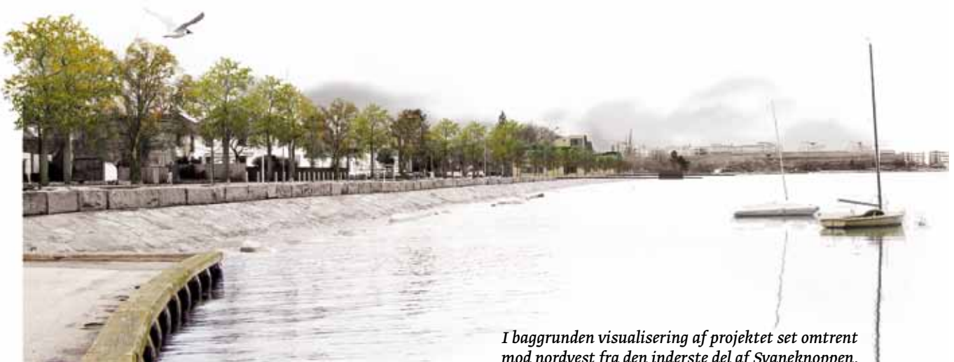
I baggrunden visualisering af projektet set omtrent mod nordvest fra den inderste del af Svaneknoppen.

Den foreslåede parkbebyggelse vil tilføje positive kvaliteter til området ved at styrke den eksisterende grønne karakter og ved at udnytte potentialet for rekreativ udfoldelse ud mod Strandpromenaden. Udformning af bebyggelsen i en åben lund fremstår indbydende og er med til at fremme muligheder bl.a. for lokal afledning af regnvand. Der skal ske en landskabelig bearbejdning af overgange mellem offentlige og private arealer, bl.a. med henblik på at undgå eventuelle konflikter mellem lokale beboere og badestrandens gæster. Det er vigtigt, at den landskabelige,