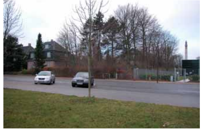
Lokalplanområdets grænse mod WHO's kontor.

Nedrivning af de eksisterende villaer, herunder Strandpromenaden 33, skaber mulighed for at opnå en mere sammenhængende bebyggelsesplan omkring gårdrummene, og for på denne måde at styrke det sociale liv i det nye boligområde. Nedrivning skaber også bedre mu-