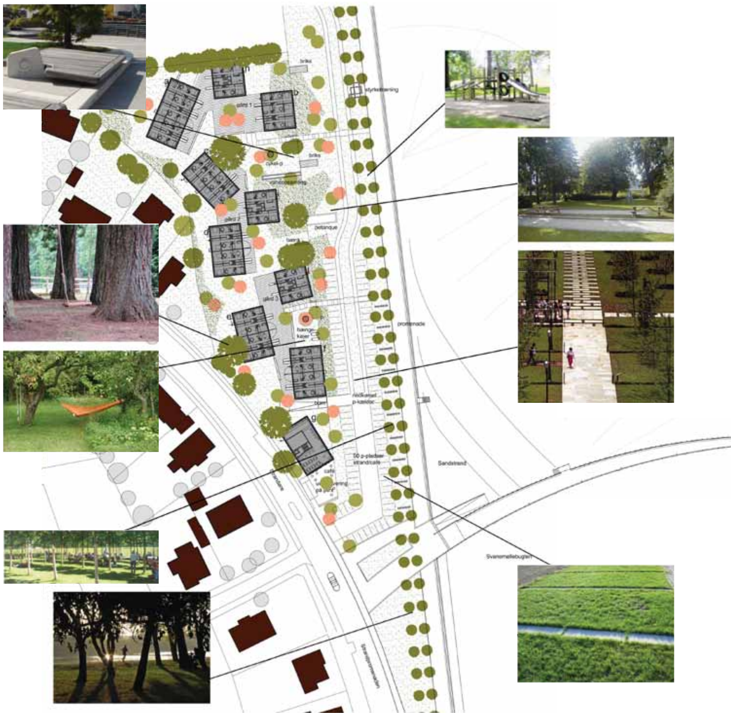
Tegnestuens dispositionsforslag med referencer til lignende natur- og havetyper.

Projektet er i 3-5 etager og har et etageareal på ca. 7.030 m 2 der indrettes til ca. 40 boliger foruden en café/restaurant. Entasis' projekt forudsætter, at den nuværende bebyggelse nedrives.