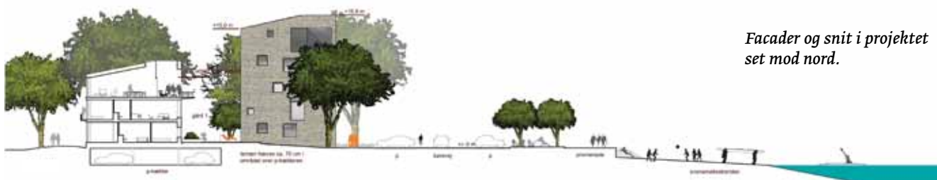
Facader og snit i projektet set mod nord.