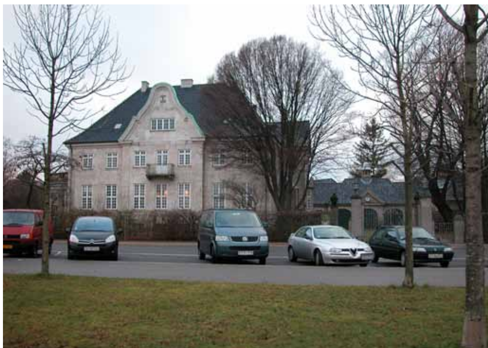
Strandpromenaden 33. Bygningsanlægget er opført i 1916 og er registreret på bevarings-trin 3 (høj bevaringsværdi).

Kombinationen af en tung klimaskærm (som tegl, beton