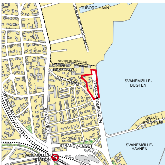
Lokalplanområdet og dets omgivelser. Lokalplanområdet, der er vist med rødt, ligger i bydelen Ydre Østerbro.

Formålet med lokalplanen er at muliggøre opførelse af en ny boligbebyggelse og bebyggelse til publikumsorienterede funktioner. Derudover er formålet med lokalplanen at fremme et mere åbent forhold mellem den nye bebyggelse og Strandpromenaden. Lokalplanen skal sikre, at den nye bebyggelse indpasses i omgivelserne. Den skal endvidere sikre hensigtsmæssige adgangsforhold til bebyggelsen samt fastlægge friarealer og parkering.