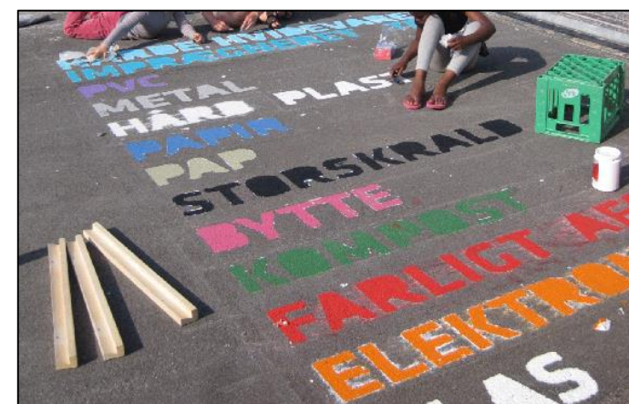
Børn involveres i udsmykning