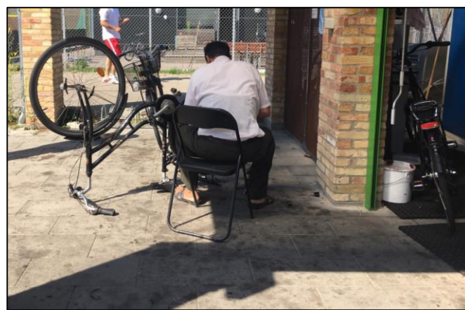
Cykelværksted- og workshop for beboerne i Hørgården