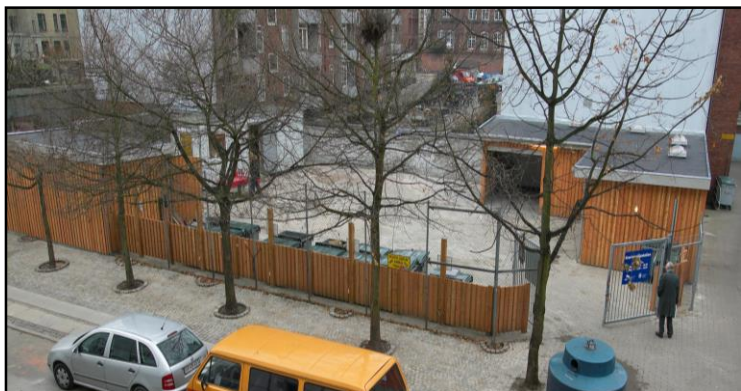
Nærgenbrugsstation i gartnergade på Nørrebro, hvor byttefaciliteterne er hyppigt besøgt.