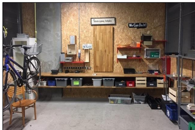
Reparationsværksted i Nordhavn