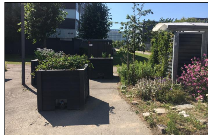
Plantekasser og byhave som beboerne passer