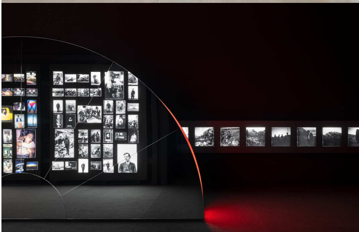
Installationsbilleder. Inuuteq Storch, Rise of the Sunken Sun , 2024. Den Danske Pavillon, Venedig Biennalen.