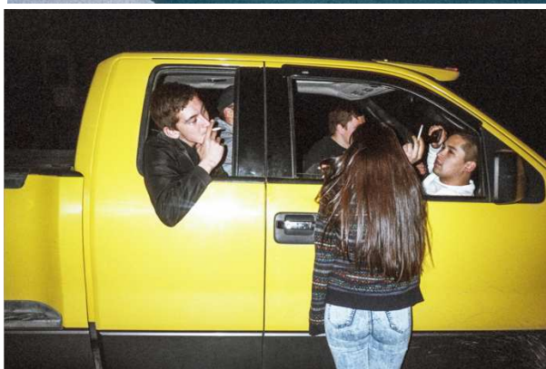
Inuuteq Storch, Soon Will Summer be Over, 2023 Inuuteq Storch, Porcelain Souls, 2019