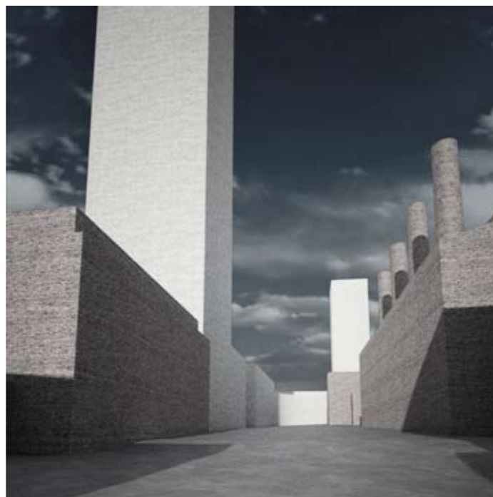
Visualiseringerne viser den sydlige del af Kulturpladsen. Øverst ses resultatet af lokalplanforslagets placeringer af højhuse og nederst ses resultatet af den justerede højhusplan: Her er det højeste højhus nr. 3 på 120 meter placeret ved siden af Mineralvandsfabrikken. Længere tilbage ses højhus nr. 9 ved Bryghuspladsen. Dette højhus er øget fra 50 til 80 meter.