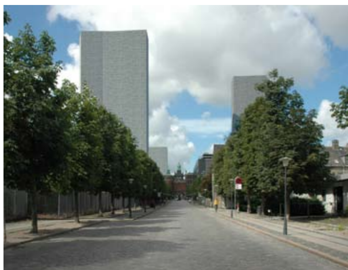
Visualiseringerne viser et kikk på ad Ny Carlsbergvej. Til venstre ses resultatet af lokalplanforslagets placering af højhuse og til højre ses resultatet efter, at højhus nr. 3 og 5 er flyttede.