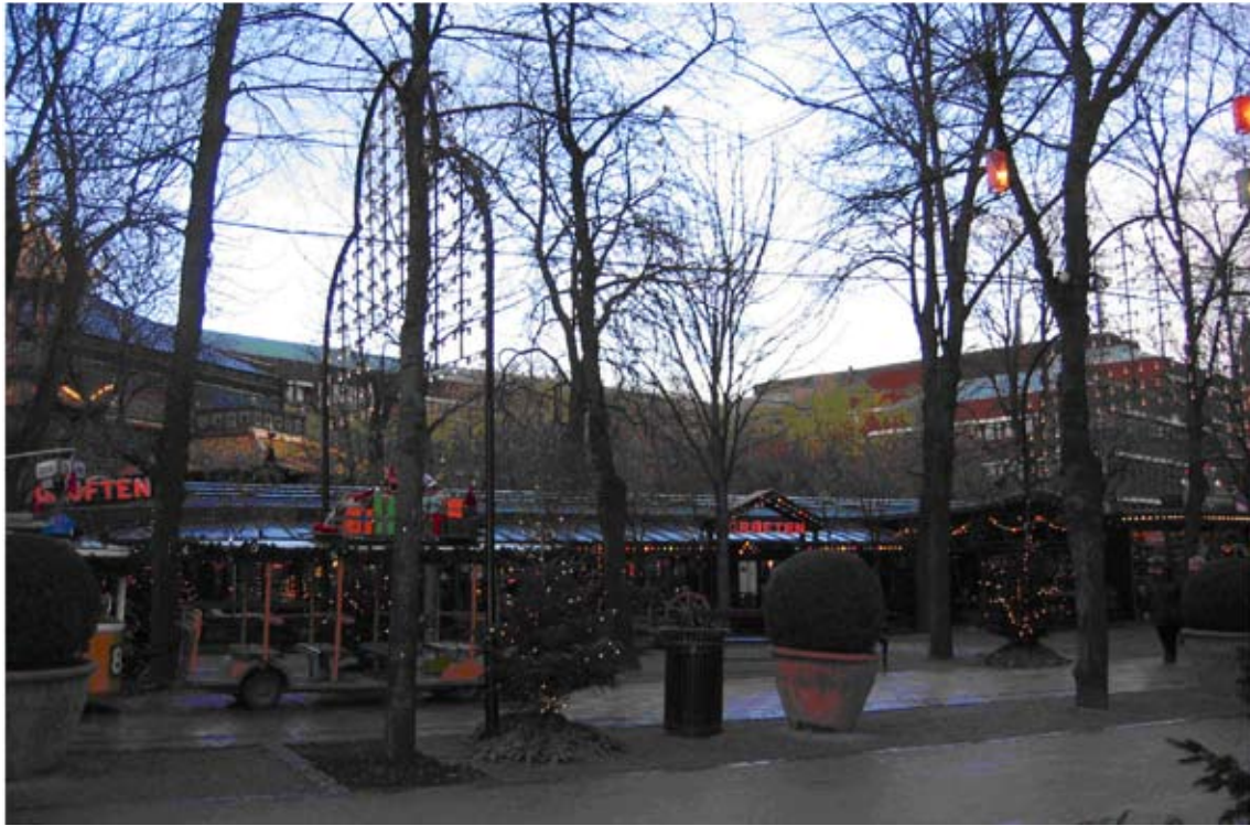
2) Grøften før Industriens Hus nuværende tunge teglfacader danner en meget bastant og kontoragtig facade mod Tivolis grønne haver.