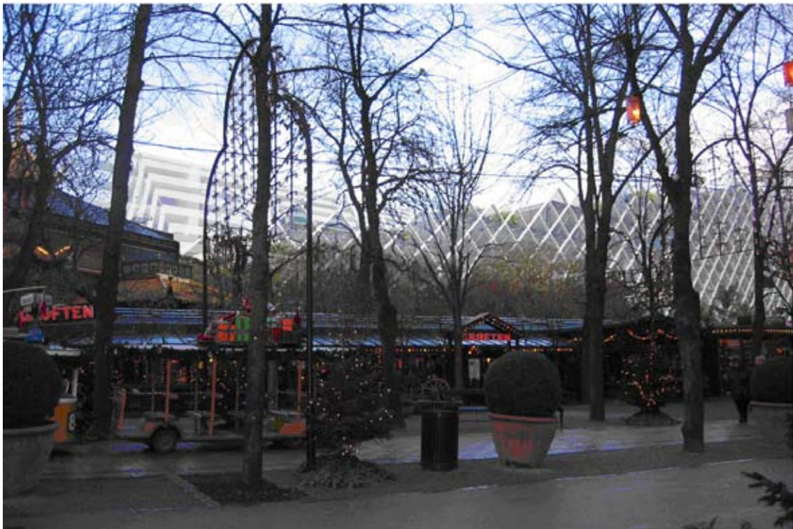
2) Grøften efter Grøftens glasfacader som forgrund for Industriens Hus nye glasfacade, der formidler nedtrapningen af bygningen mod Pantomimeteatret. Kodeordene er de typiske for Tivoli: gennemsigtighed, transparens og spejlinger.