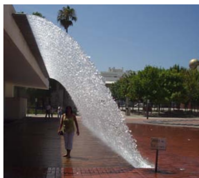
Eksempler på brug af vand (Malmø og Lissabon)