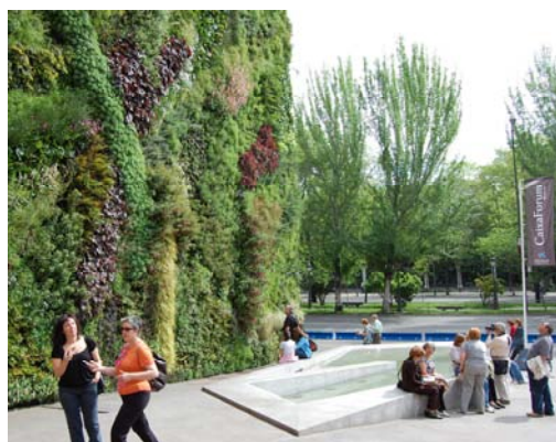
Eksempler på facadebeplantning Madrid