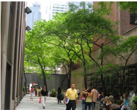
Greenacre park, New York