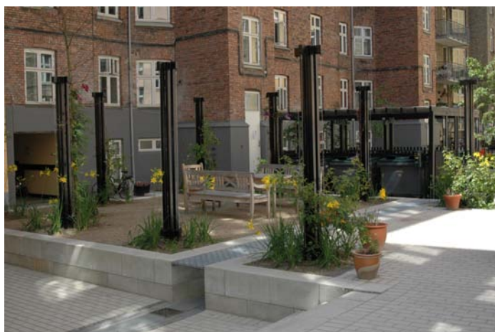
Eksempel på anlæg, Nøjsomhedsvej, København