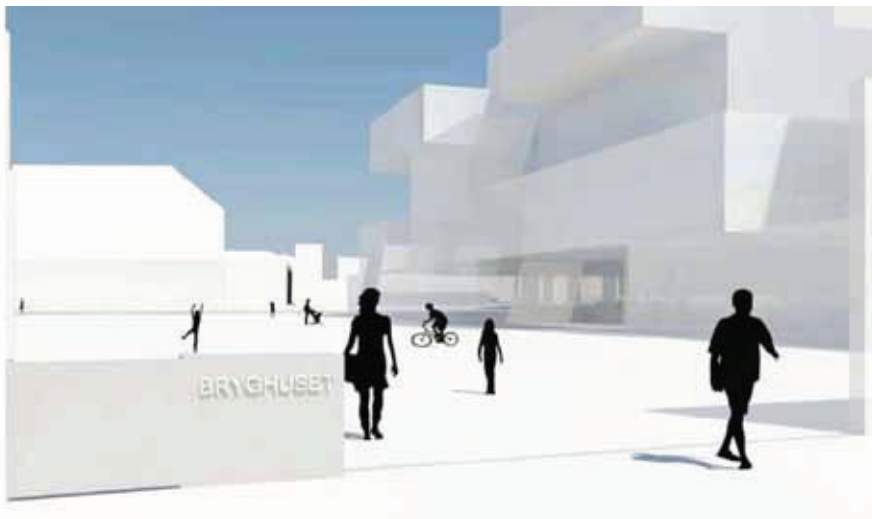
3d illustration, åbent hegn.