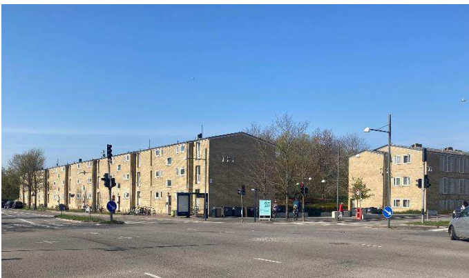
Foto: Eksisterende boligbebyggelse der påbygges yderligere tagetage. Set fra Terrasserne mod syd.