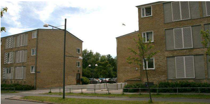
Foto: Eksisterende boligbebyggelse der påbygges yderligere tagetage. Set fra Ruten mod syd.