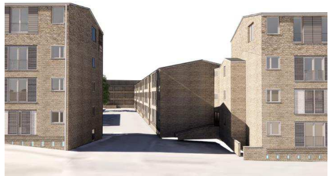
Illustration: Eksempel på udseende af tagetage ifølge lokalplanen. Illustration Vandkunsten.