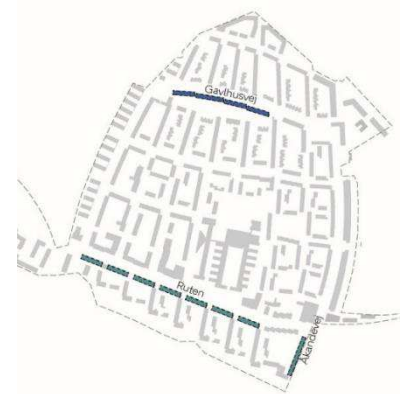
Illustration 1: Kort over foreslåede placeringer for nye tagetage. Illustration: Vandkunsten

Påbygningen af en ekstra etage med tagboliger placeres på bygninger langs Åkandevej, del af Ruten og gaden Gavlhusvej.