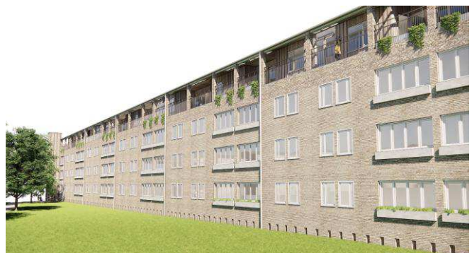
Illustration: Eksempel på udseende af tagetage ifølge lokalplanen. Illustration Vandkunsten.