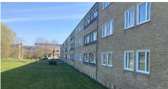
Foto: Eksisterende boligbebyggelse der påbygges yderligere tagetage. Set fra haverum ved Åkandevej set mod nord.