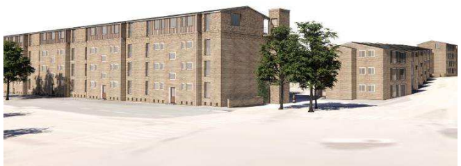
Illustration: Eksempel på udseende af tagetage ifølge lokalplanen. Illustration Vandkunsten.