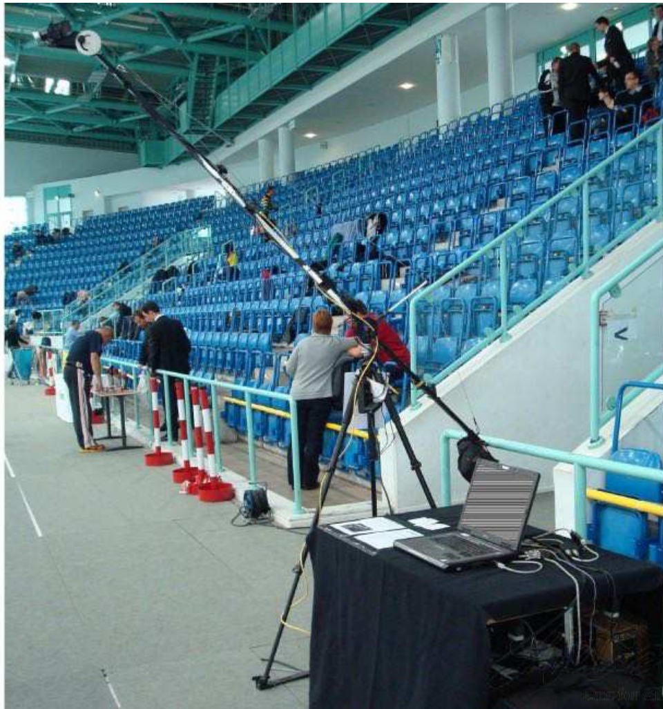
1 Eksempel på VAR system til fægting