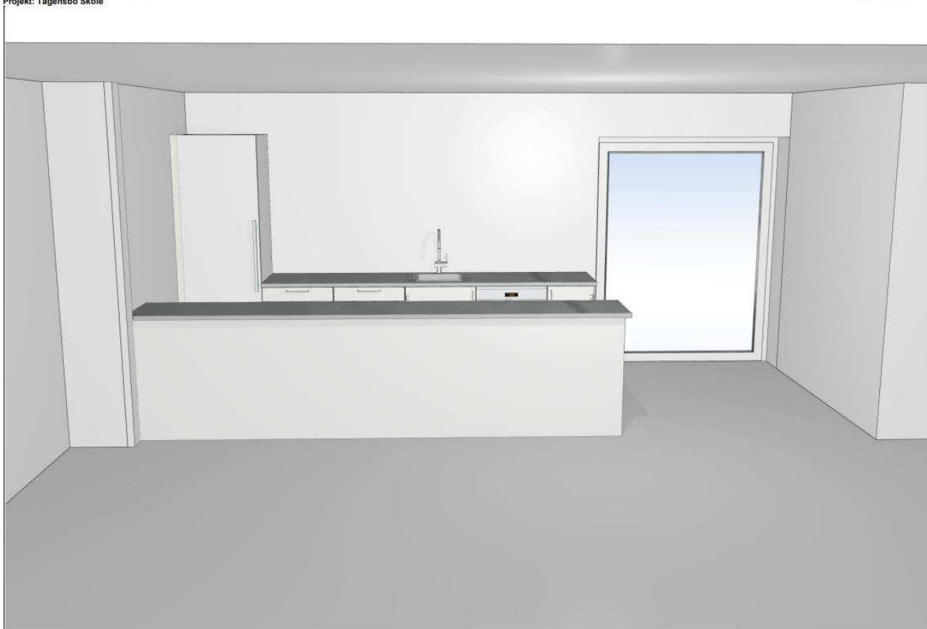
Perspektivtegning på muligt tekøkken af Kolon, der også har rådgivet om priser