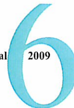
Tabel 56 Kommunal nettodriftsudgift på børnepasningsområdet - budget 2009