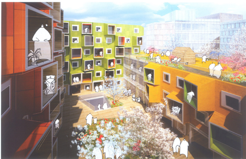
Gårdrummet og tagterrassen på 3. sal af sidebygningen vil give uderum med både oplevelser og kvalitet. Det er beskrevet indrettet varieret og med mest mulig appel til sanserne uden at gå på kompromis med tilgængelighed.