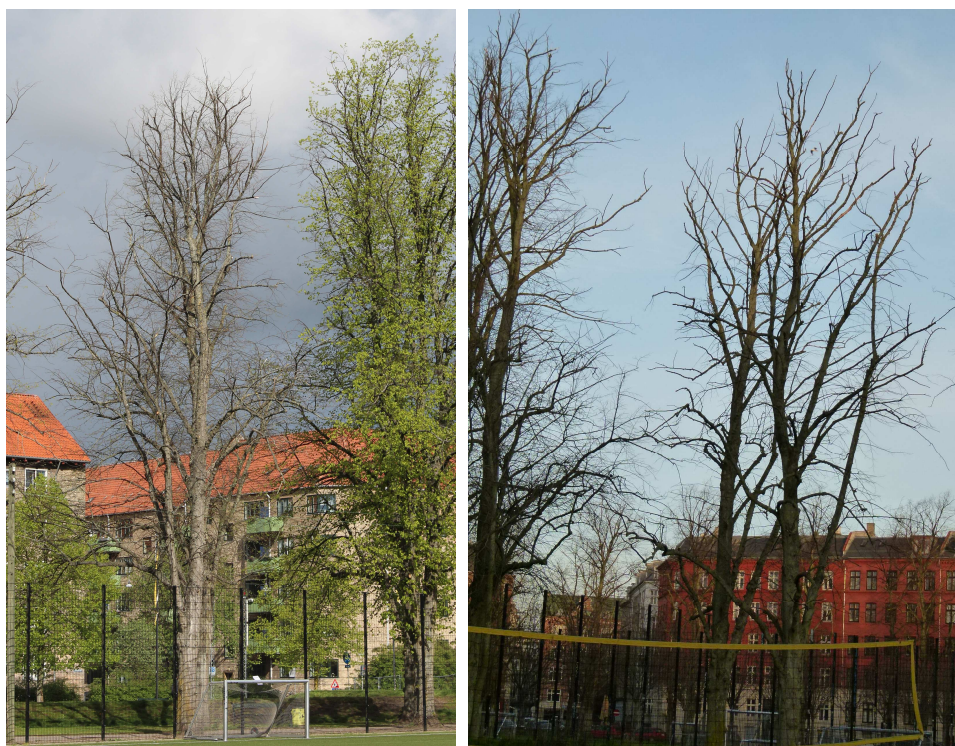
De samme to træer set fra hver sin side i hhv. maj og december 2019. Manglende småkviste og døde grene præger træerne som tegn på dårlige vækstforhold og tørkestress.