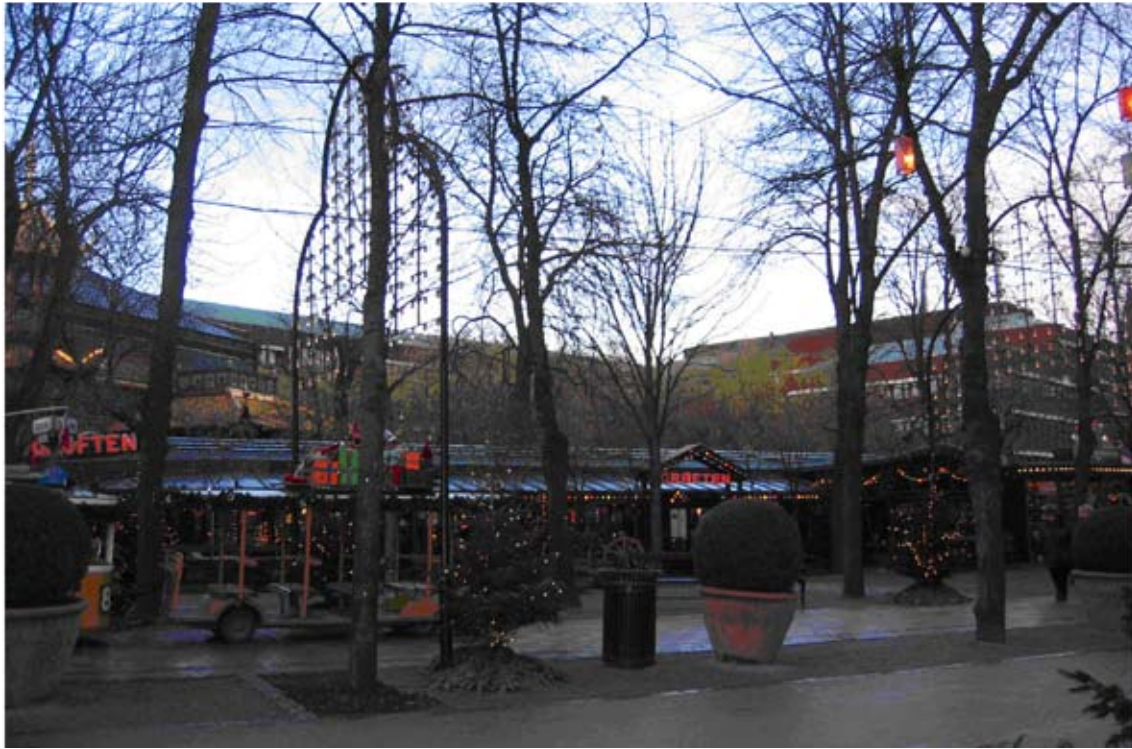
2) Grøften før Industriens Hus nuværende tunge teglfacader danner en meget bastant og kontoragtig facade mod Tivolis grønne haver.