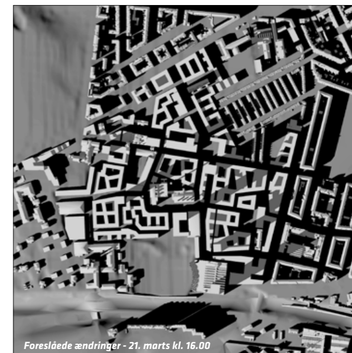
Skyggediagrammerne viser lokalplanens område den 21. marts kl. 12 og 16. Til venstre vises resultatet af lokalplanforslagets placering af højhuse og til højre ses resultatet af den justerede højhusplan. Det kan blandt andet fornemmes, hvordan flytning af højhus nr. 3 giver forbedrede lysforhold i Humleby, og hvordan reduktion af højhus nr. 4 giver bedre lysforhold for naboerne på Vesterbro. På www.kk.dk/lokalplanforslag kan der ses yderligere skyggediagrammer.