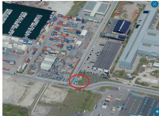
(KK Kort 2023)