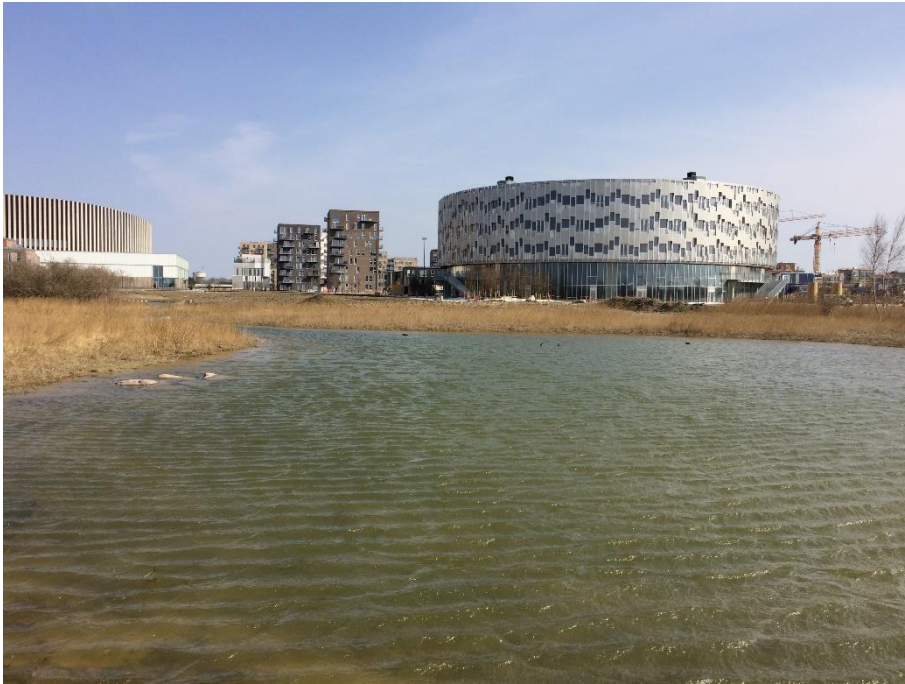
Den nye sø