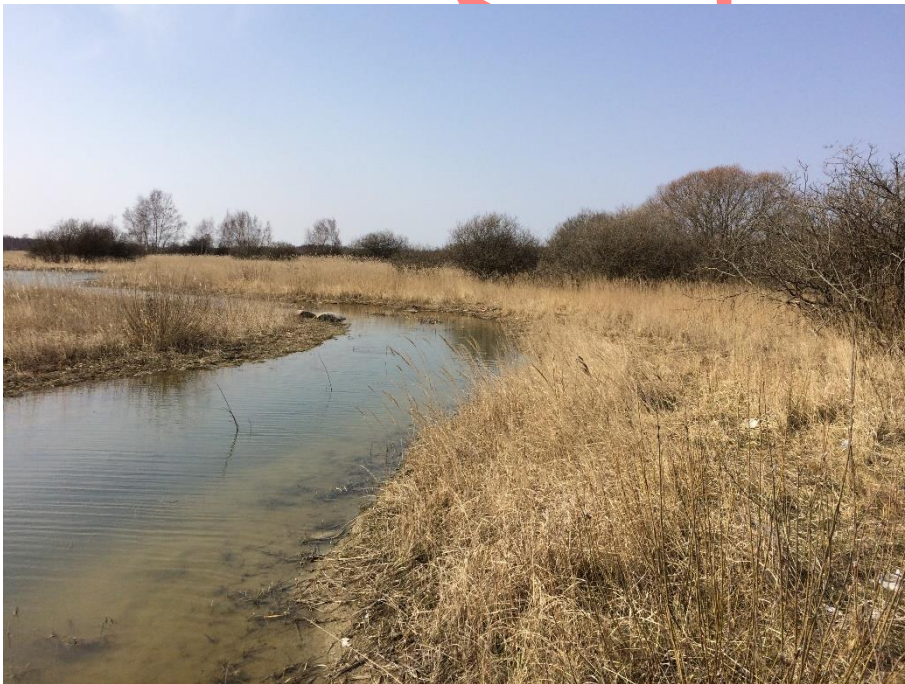
Det nye vandløb