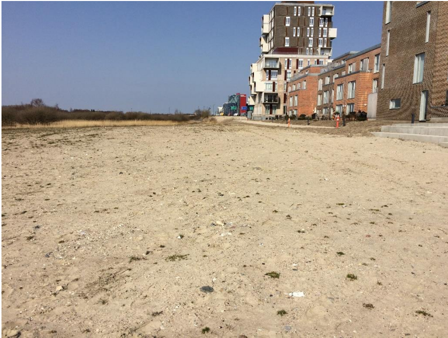
Den nordlige del af jordpåfyldningen