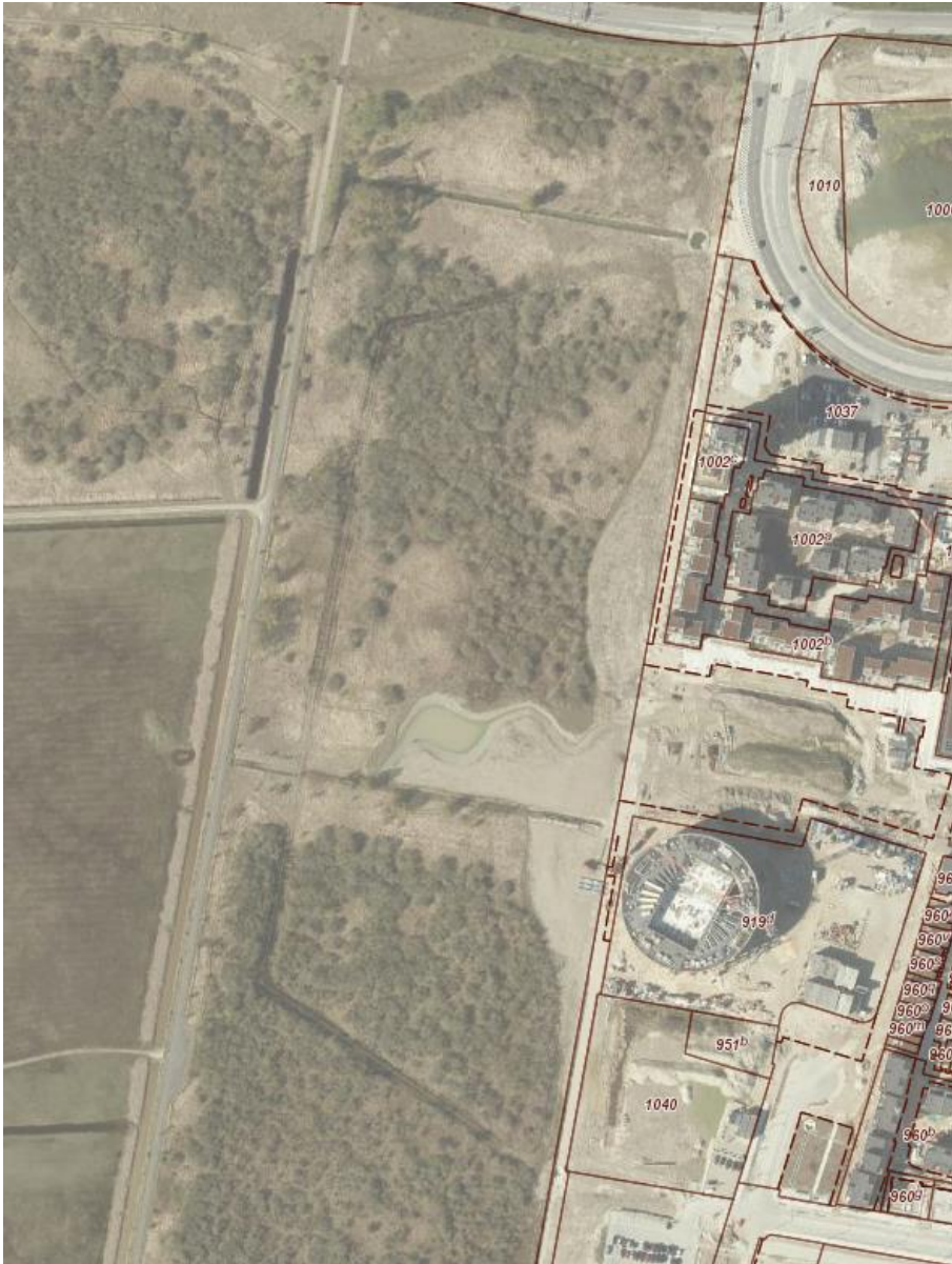
Luftfoto fra foråret 2017. Området med bar jord vest for den røde matrikelgrænse viser det samlede indgrebs udstrækning.