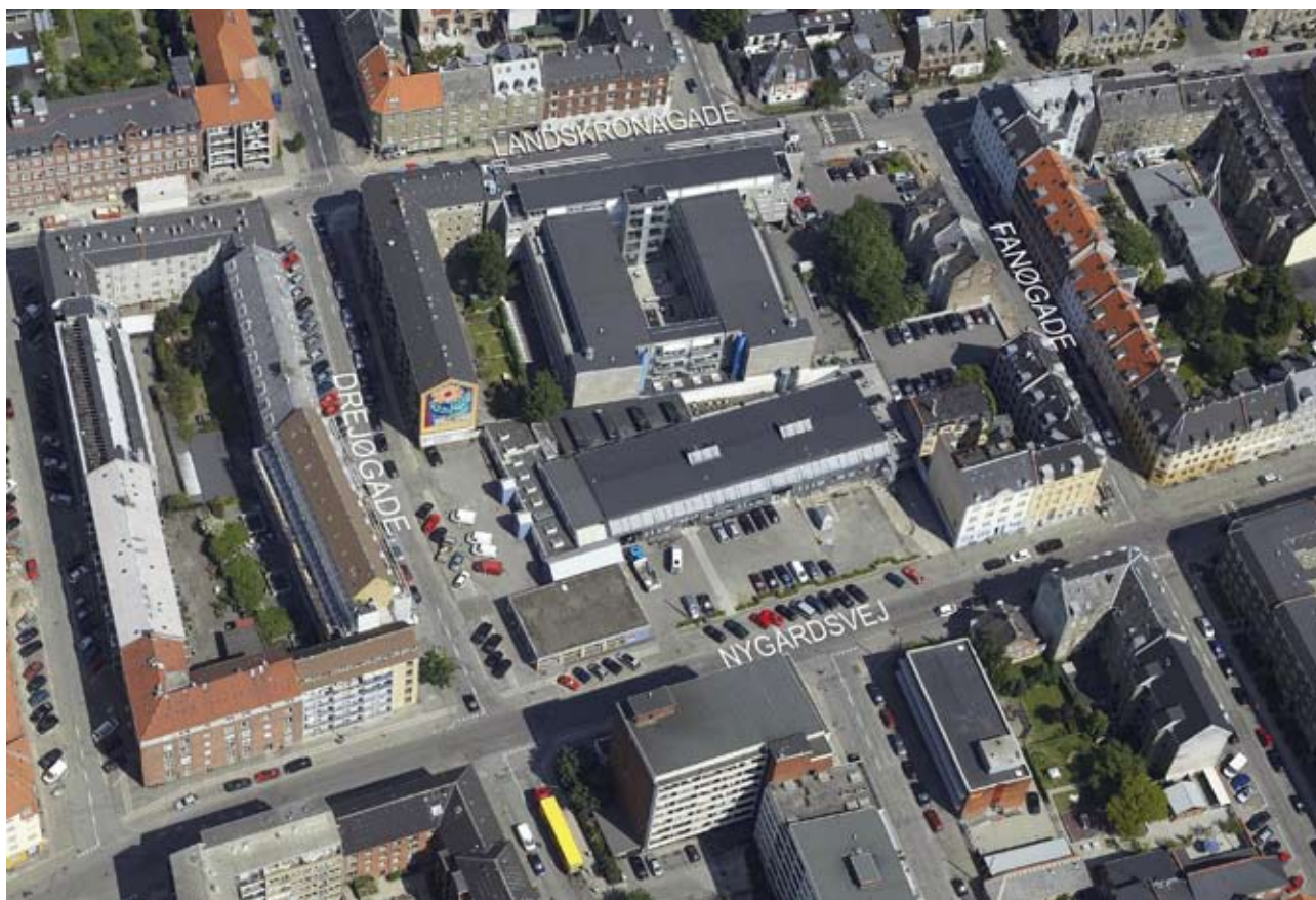
Lokalplanområdet set mod nord. (Luftfoto juli 2007).