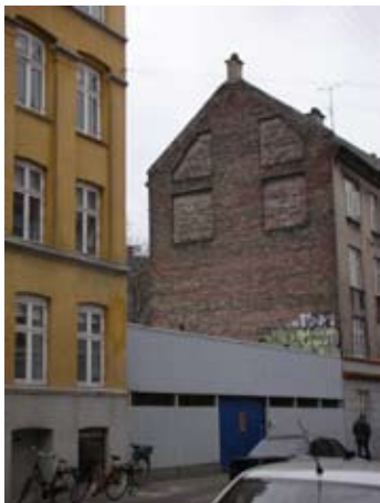
Arbejdstilsynets parkeringsdæk ved Fanøgade. I bygningen til højre ønskes indretning af tagboliger.

Lokalplanområdet ligger i bydelen Østerbro og er begrænset af Landskronagade, Fanøgade, Nygårdsvej og Drejøgade.