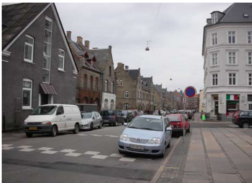
Landskronagade mod Østerbrogade med byggeforeningshusene i midten af billedet.