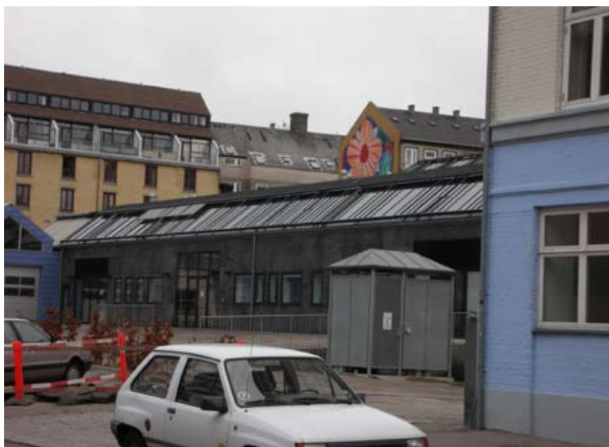
Nygårdsvej. Her bliver plads til nyt boligbyggeri, hvis erhvervsbebyggelsen nedrives.