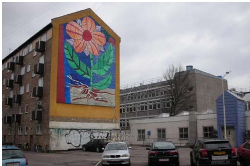
Til venstre ses boligbebyggelse ved Drejøgade. Til højre lav, renoveret erhvervsbebyggelse med Arbejdstilsynet i baggrunden.