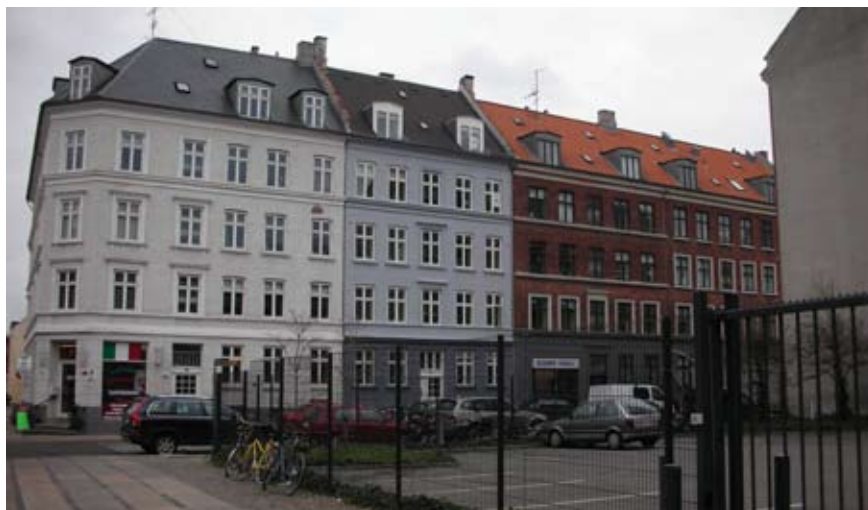
Facader i Fanøgade overfor lokalplanområdet.

Lokalplanområdet ligger stationsnært i forhold til Svanemøllen Station og tæt på anden kollektiv trafik på bl.a. Østerbrogade. Der er let adgang til Lyngbyvej mv. for individuel trafik.