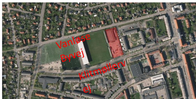
Markeret område dækker over omtalt areal

Det asfalterede areal ved Vanløse Idrætsanlæg fremstår i dag forsømt og er i ringe stand. Området har et stort potentiale, i kraft af den store lokale efterspørgsel efter flere idrætsfaciliteter. En investering i området vil således kunne være til glæde og gavn for lokalområdets beboere og mange foreninger.