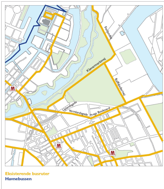
Figur 2. Busruter i området

Der bør derfor ske en opgradering af den kollektive transport. Det bør ske fra første færd for ikke at få en unødigt stigning i biltrafikken. Det foreslås, at området i første omgang forsynes med flere busruter med højere frekvens - specielt med en god forbindelse til metrostationerne. Dette skal indarbejdes i den fremtidige busplanlægning. På længere sigt, når Refshaleøen også kommer i spil, vil en metrolinie i området evt. kunne komme på tale.