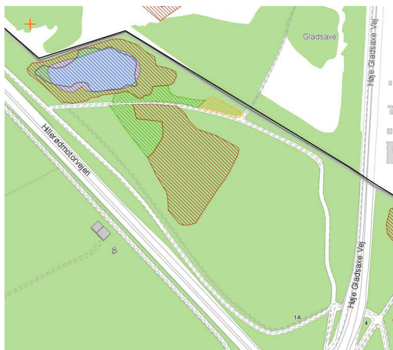
Fig 2: §3-kort fra Miljøportalen Kommunegrænse angivet med sort streg. Naturtyperne mose (rødbrun skravering), eng (grøn skravering), overdrev (orange skravering), og sø (blå skraveringer).

Desuden etableres adgangsmuligheder til græsningsfolden i stil med indgangene i den eksisterende fold, så den offentlige adgang fortsat sikres.