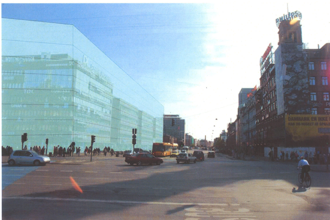
Billede 1: Set fra Rådhuspladsen