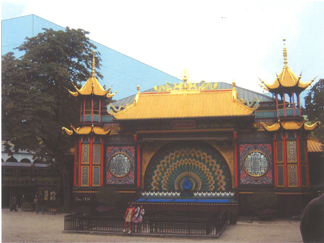
Billede 4: Set fra Pantomimeteatret