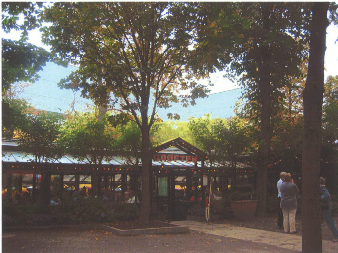
Billede 5: Set fra Grøften