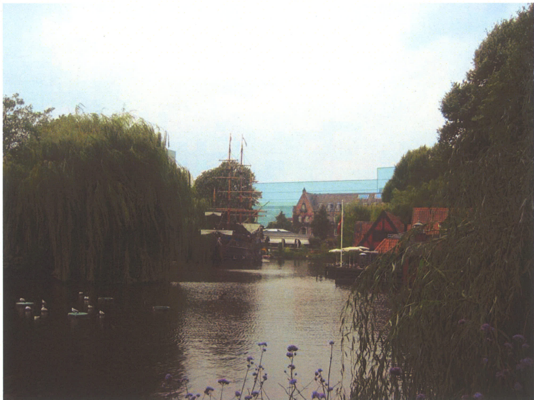
Billede 3: Set fra Tivolisøen