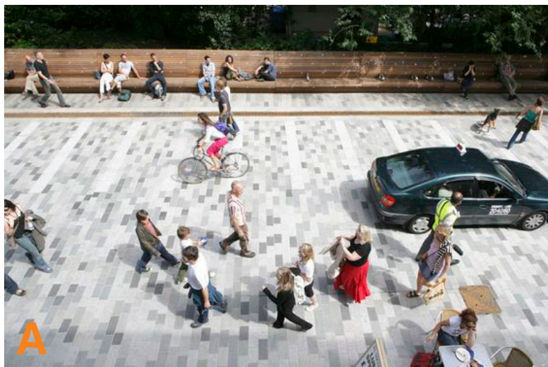
A Eksempel på shared space