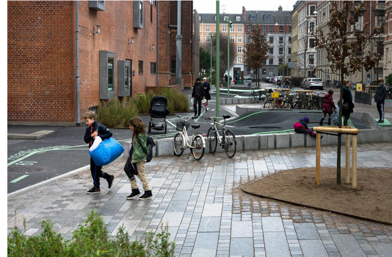
Tove Ditlevsen gade, plads og skolegård