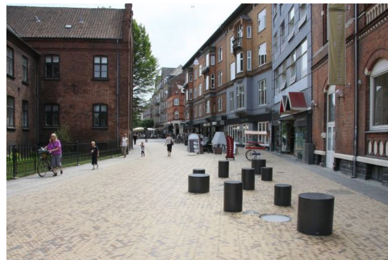
Gågade, Odense, sidde- og legeplint