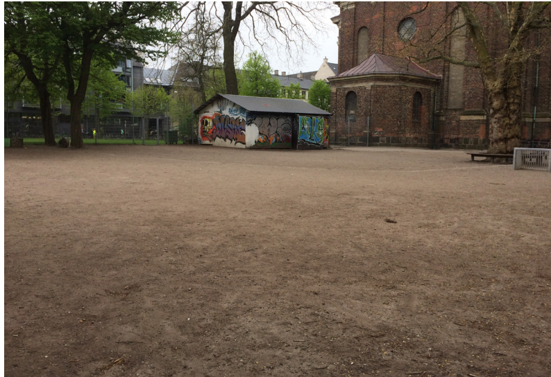
Gruspladsen ved kirken