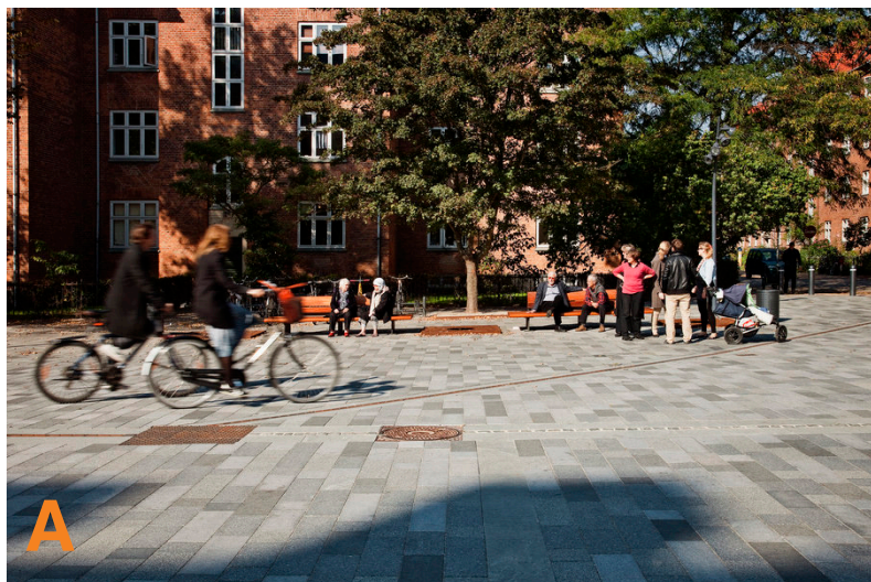
A Shared space, Guldberg skole