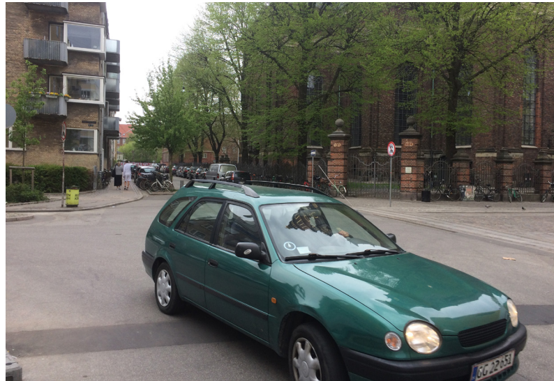
Parkering og trafik i Dronningensgade