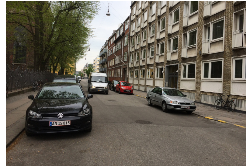
Parkering og trafik i Dronningensgade