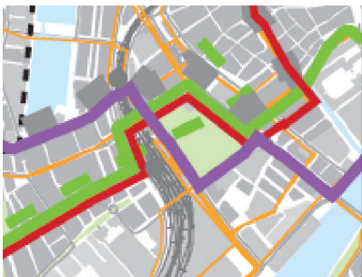
Kort for Linie 14 – bilag 2, s. 8. Linje 14 vist med rød Linje 10 vist med grøn

I øvrigt har vi bemærket, at der i bilag 2 er vist to forskellige ruter for linje 14's passage af Hovedbanegården. Ifølge kort s. 8 for Linje 14 fremgår det, at ruten går via Rådhuspladsen og passerer Hovedbanegården v. Reventlowsgade (tilsvarende ruten for linje 10). Men ifølge kort s. 4 og s. 5 går ruten via Tietgensgade og Tietgensbro. Lokaludvalget finder det mest hensigtsmæssigt at begge ruter føres af samme rute, som vist s. 8 – da det giver en bedre betjening fra Hovedbanegården til Vesterbro og Bavnehøjkvarteret, hvor linje 10 og linje 14 følger samme rute.