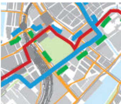
Kort for Linie 10 – bilag 2, s.5. Linje 14 vist med blå Linje 10 vist med rød