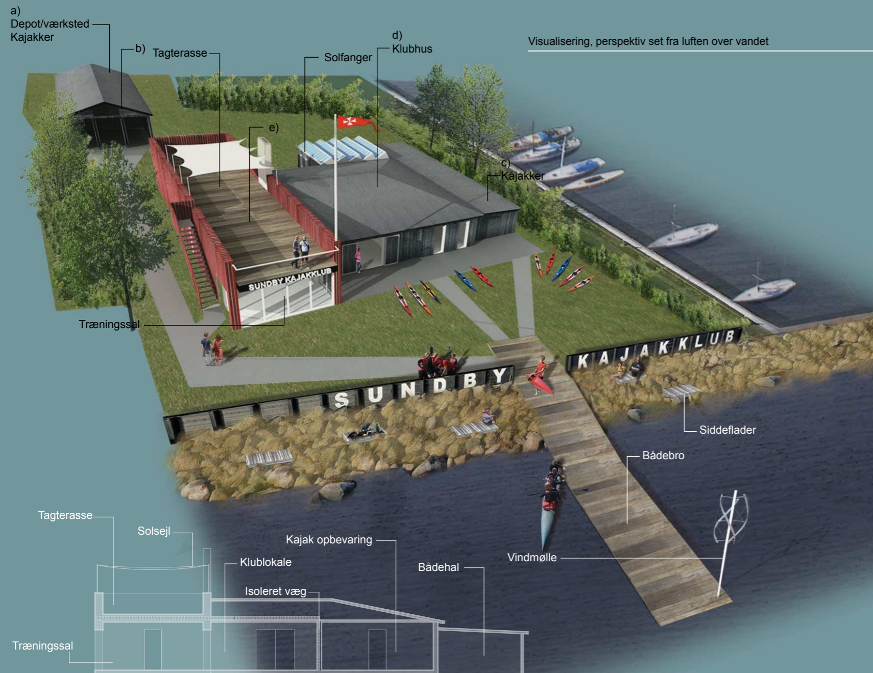
Snit 1:200 gennem bådehal (c), klublokale (d) og ny tilbygning (e)