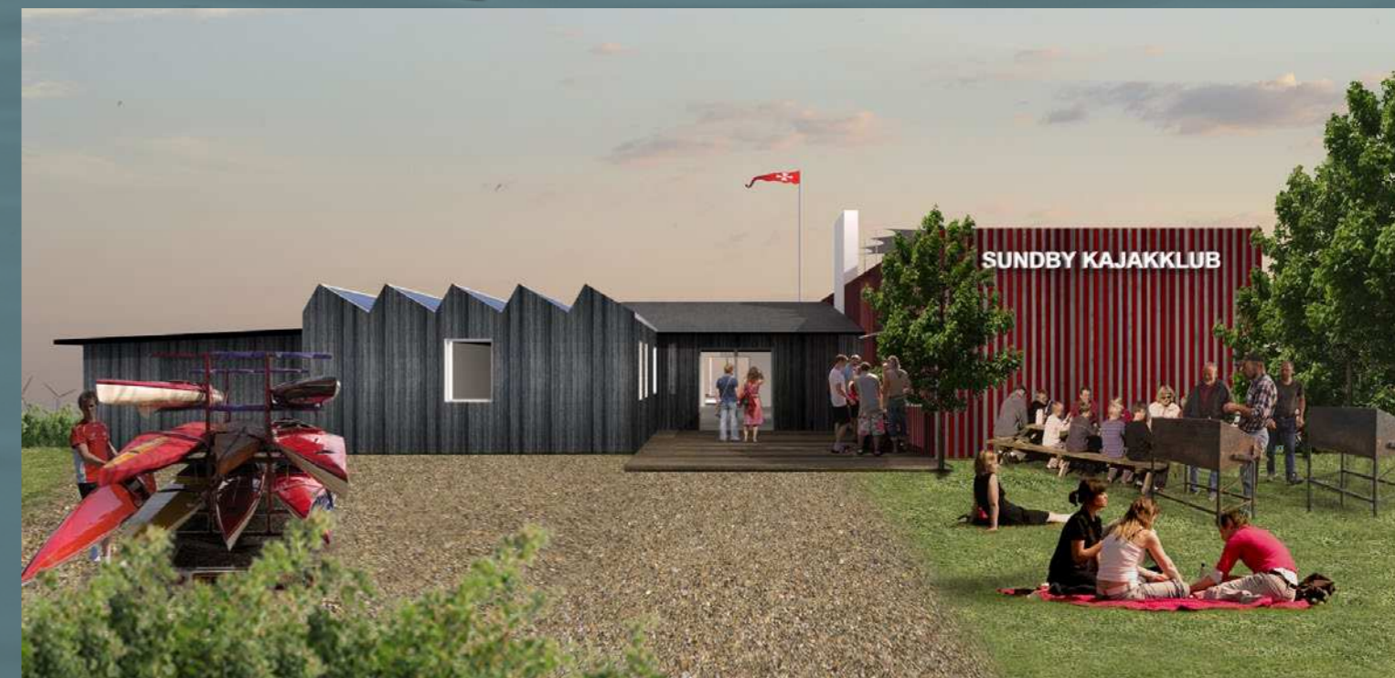
Ankomst til klubhuset og haven med den store grillplads