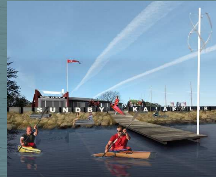
Klubhuset set fra vandet med ny højvandsbeskyttelse og vindmølle

Klimatilpasning er også tænkt ind i planen – bølgeskærmen ud mod Øresund kan udformes som en højdevandssikring med lukkeport og mulighed for integration med naboforeningernes fremtidige løsninger på vandstigning.