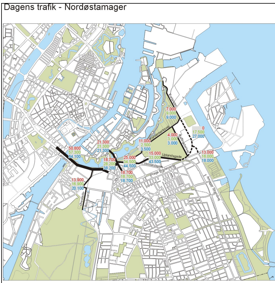
Figur 1. Dagens døgntrafik og forventet fremtidig døgntrafik som følge af byudviklingen beskrevet i tabel 1 og 2.

Den nye vejstruktur anbefales fremtidssikret med en 50 m. bred trafikkorridor fra Refshaleøen forbi Margretheholm og videre ad Forlandet og dennes forlængelse til Prags Boulevard. Denne korridor kan rumme en ny vejforbindelse til Refshaleøen (og til Nordhavnsområdet) samt busbaner eller en anden højklasset kollektiv trafikforbindelse. Et vejudlæg på 50 m. vil sikre, at det er muligt i fremtiden at etablere en fremtidig trafikkorridor i form af en nedgravet vejforbindelse.