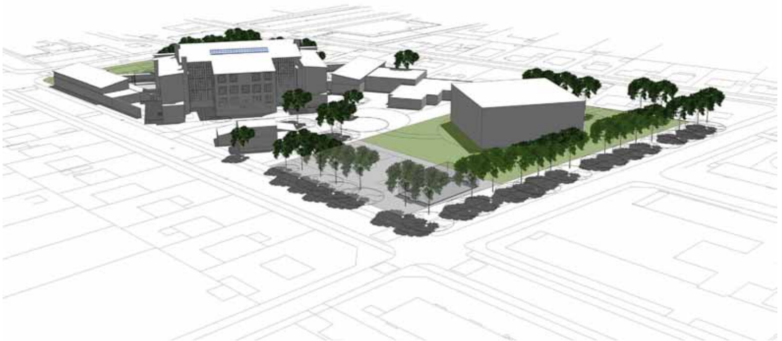
Isometri set fra nord.