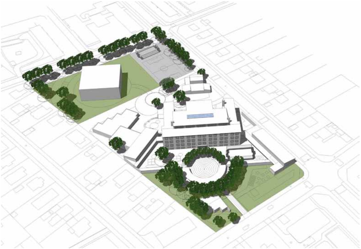
Isometri set fra syd.