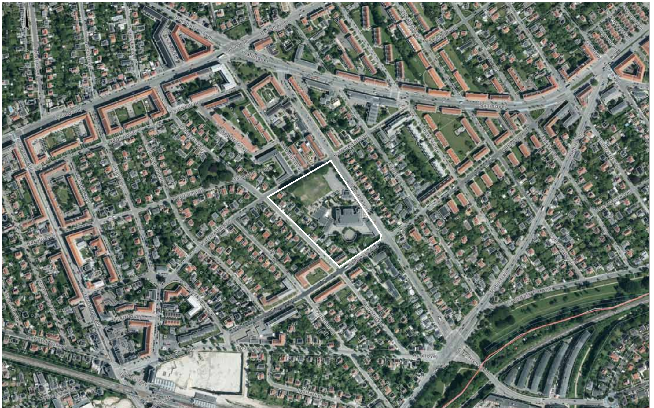
Bilag 3. Luftfoto af lokalplanområdet og kvarteret.